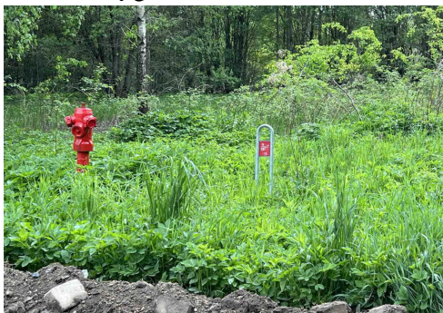
priešgaisrinio hidranto fotografacija

Gaisrų gesinimas numatomas nuo esamo priešgaisrinio hidranto ties planuojamais sklypais.