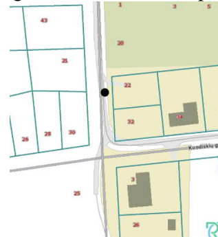
priešgaisrinio hidranto foto vieta pagal regia.lt

Artimiausias priešgaisrinio gelbėjimo pajėgų padalinys – Vilniaus apskrities Priešgaisrinė gelbėjimo valdyba, 4 –oji komanda, Pergalės g. 31, Vilniuje. Atstumas – 3,23 km, atvykimo laikas – 7 min.