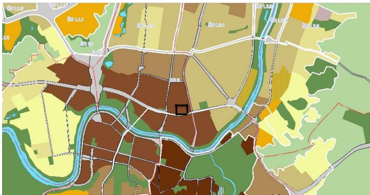
Ištrauka iš Vilniaus miesto bendrojo plano (iki 2015m.).

Rengiant paskirties pakeitimo projektą buvo atsižvelgta į Nekilnojamojo kultūros paveldo įstatymą. Kadangi patalpose nebus atliekami statybos darbai, tai neturės neigiamos įtakos kultūros paveldo teritorijai.