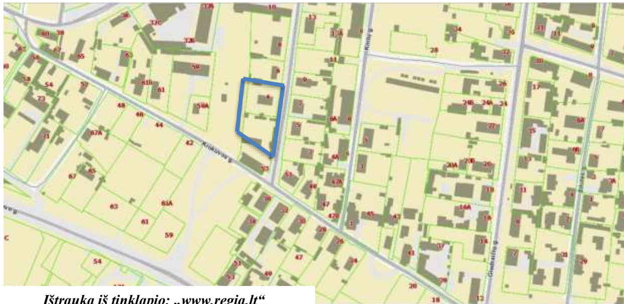
Ištrauka iš tinklapio: „www.regia.lt“

Objektas – Daugiabučio gyvenamojo namo Šeimyniškių g. 12-5, Vilniuje, negyvenamosios patalpos – kurybinių dirbtuvių paskirties keitimo į paslaugų paskirtį projektas