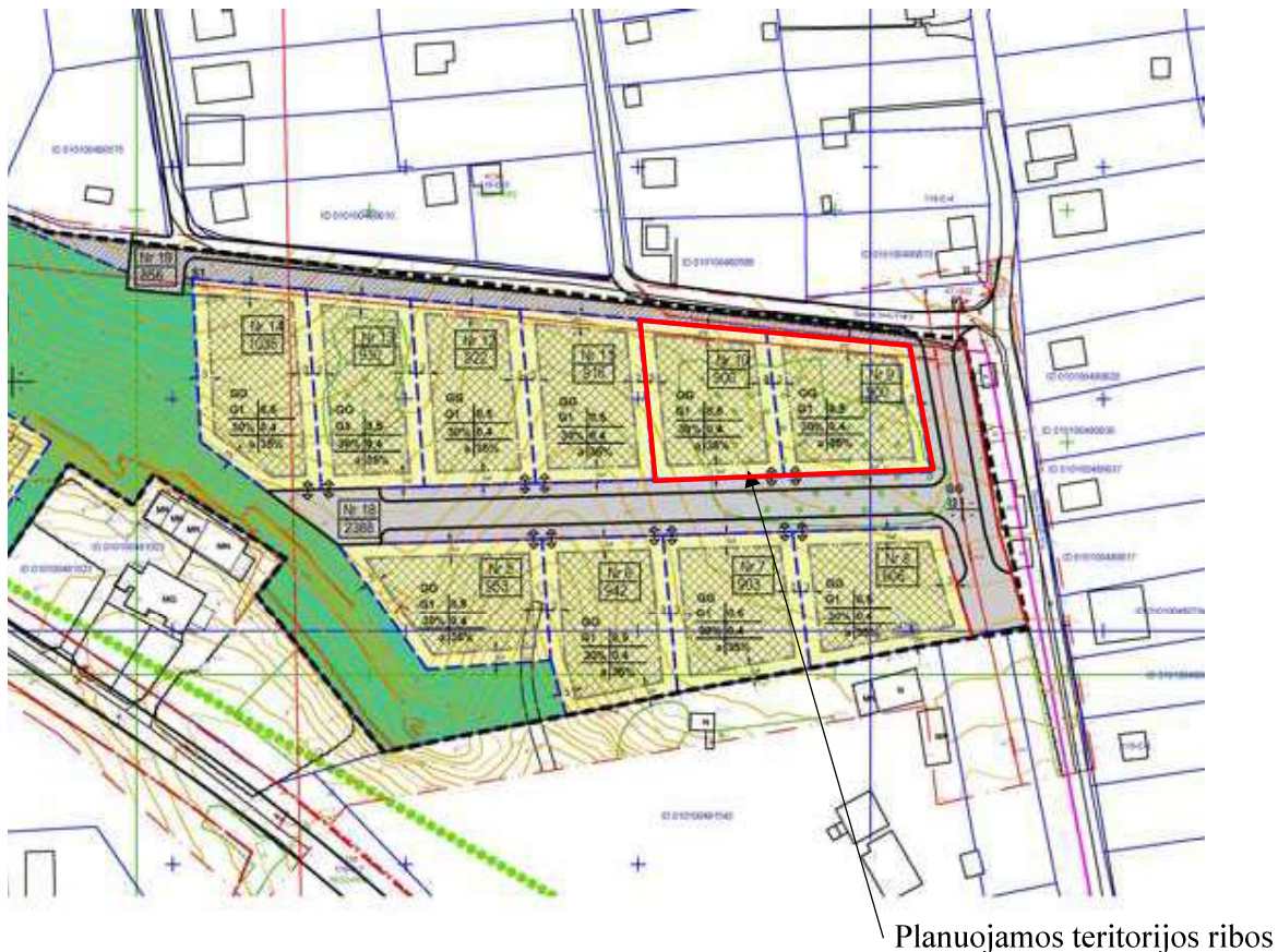
2 pav. Detaliojo plano pagrindinio brėžinio ištrauka su pažymėta planuojama teritorija

Detaliojo plano koregavimas rengiamas žemės sklypų, Šiaurės sodų 6-oji g. 2D ir 2E, Vilniuje ribose. 2 pav. pateikiama minėto detaliojo plano pagrindinio brėžinio ištrauka su pažymėta planuojama teritorija.