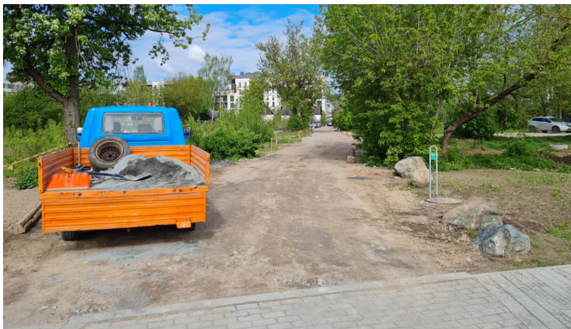
2 pav. Krokuvos g.