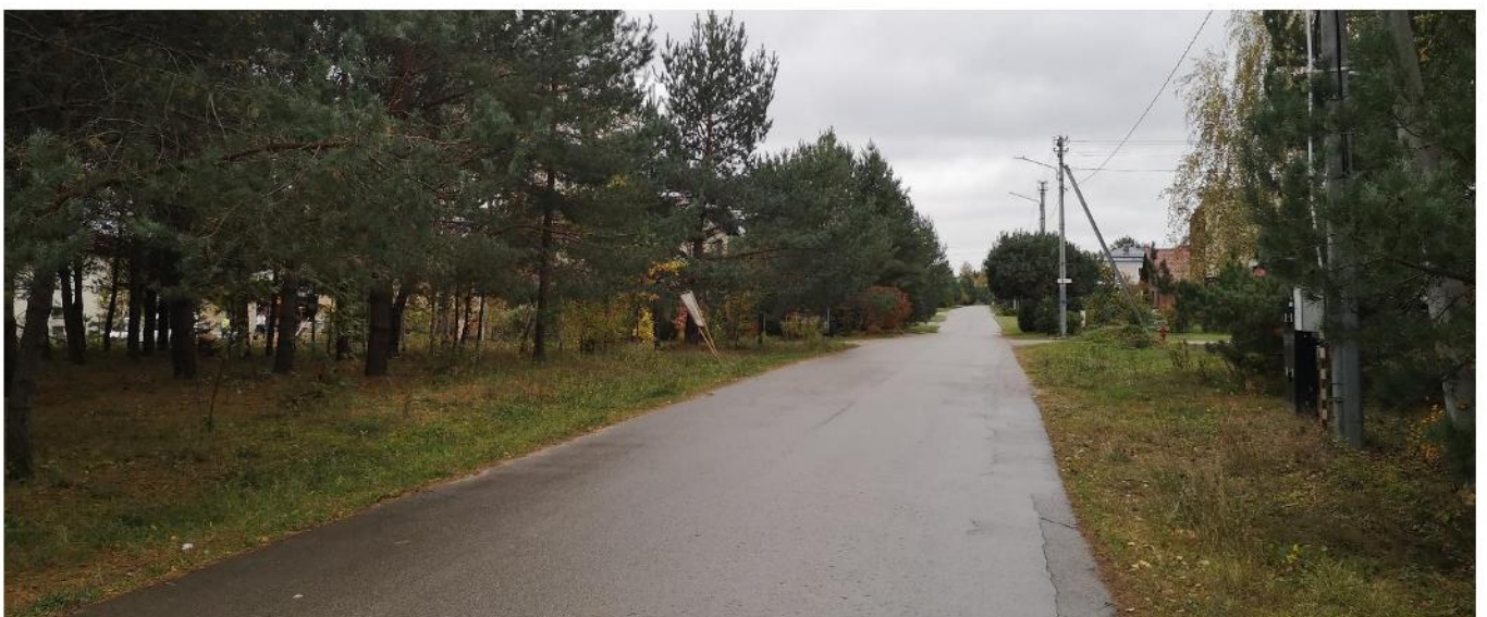
Foto fikscija Nr. 12. Jundos gatvė vakarų kryptimi