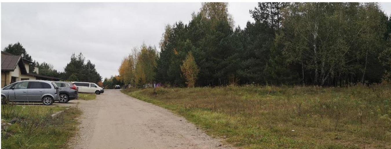
Foto fiksacija Nr. 3. Aušrinės gatvė šiaurės kryptimi