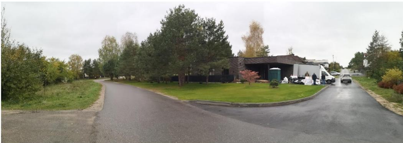
Foto fiksacija Nr. 7. Vaidevučio ir Bulvikio gatvių sankryža šiaurės vakarų kryptimi