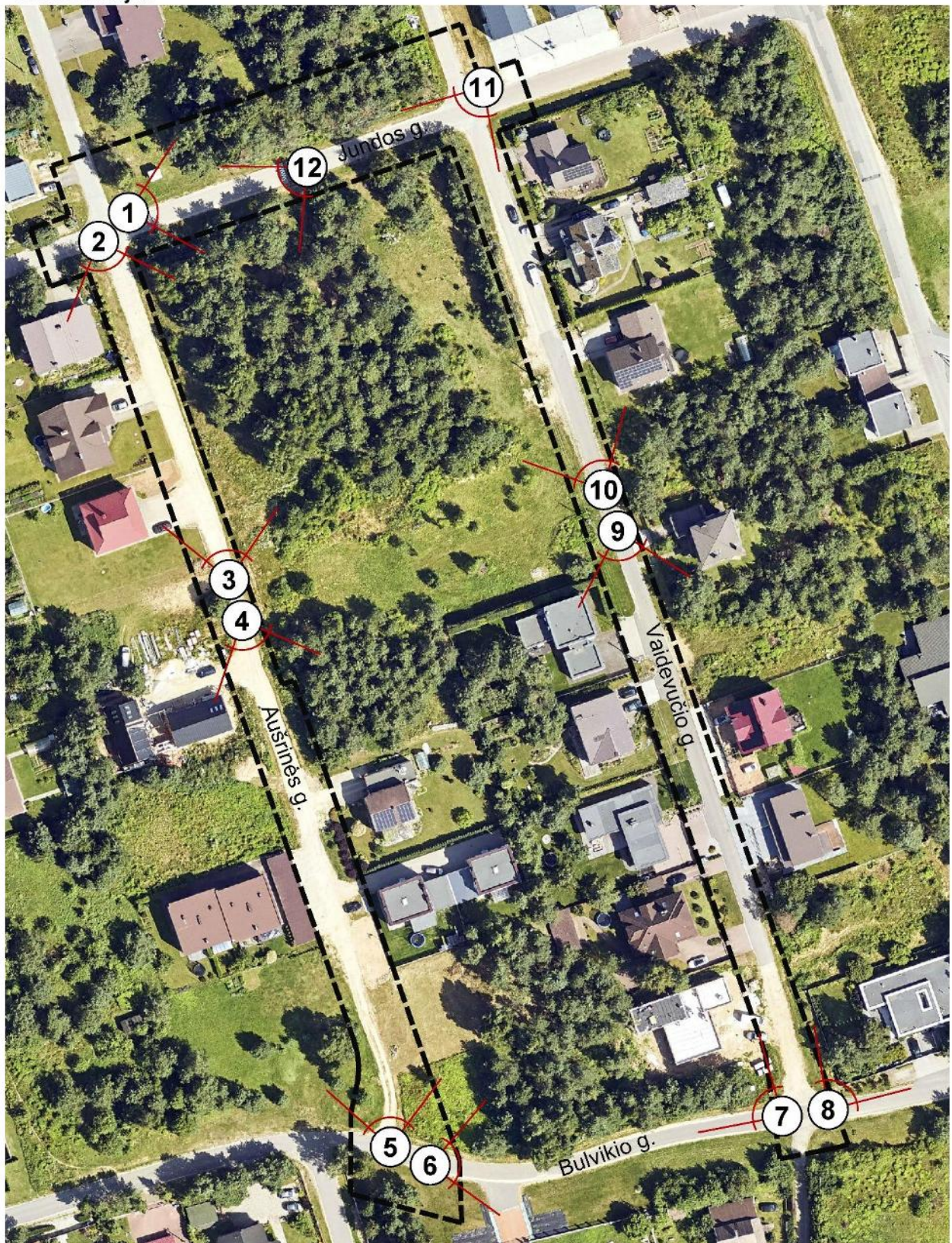
Foto fiksacijų schema