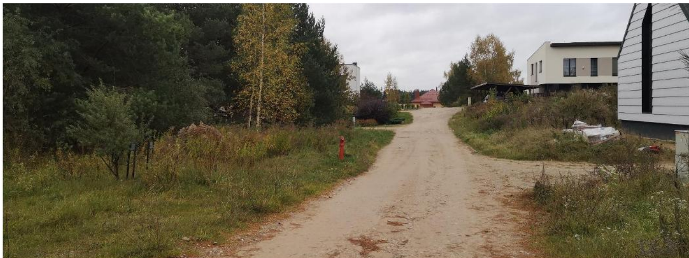
Foto fiksacija Nr. 4. Aušrinės gatvė pietų kryptimi