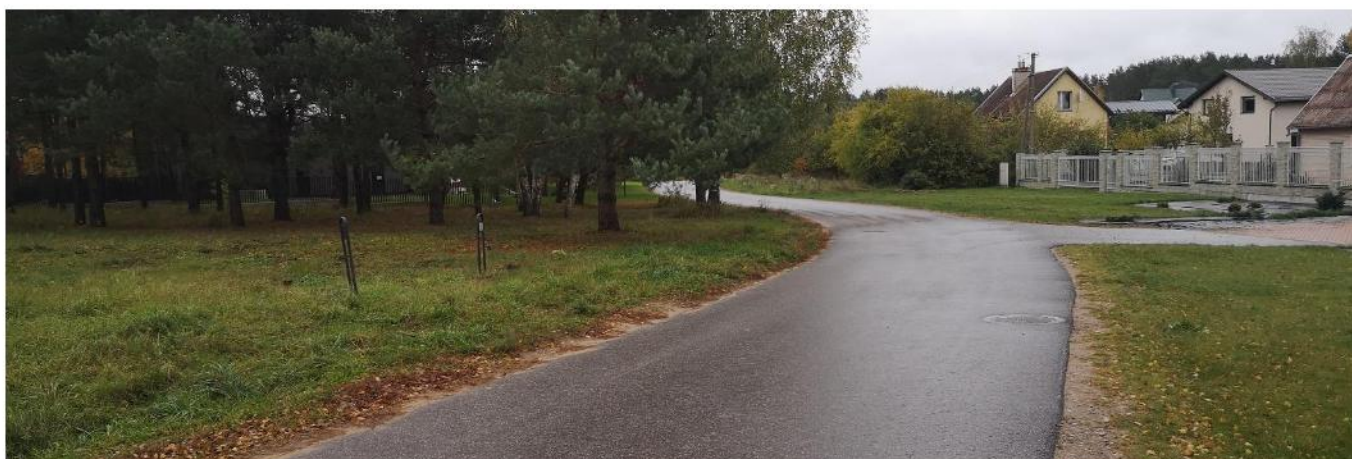
Foto fiksacija Nr. 6. Bulvicio gatvė rytų kryptimi