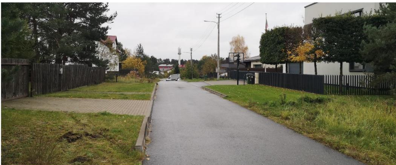
Foto fiksacija Nr. 9. Vaidevučio gatvė pietų kryptimi