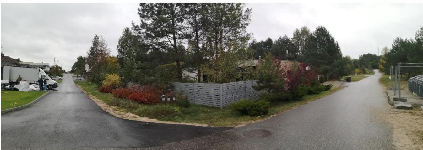
Foto fiksacija Nr. 8. Vaidevučio ir Bulvikio gatvių sankryža šiaurės rytų kryptimi