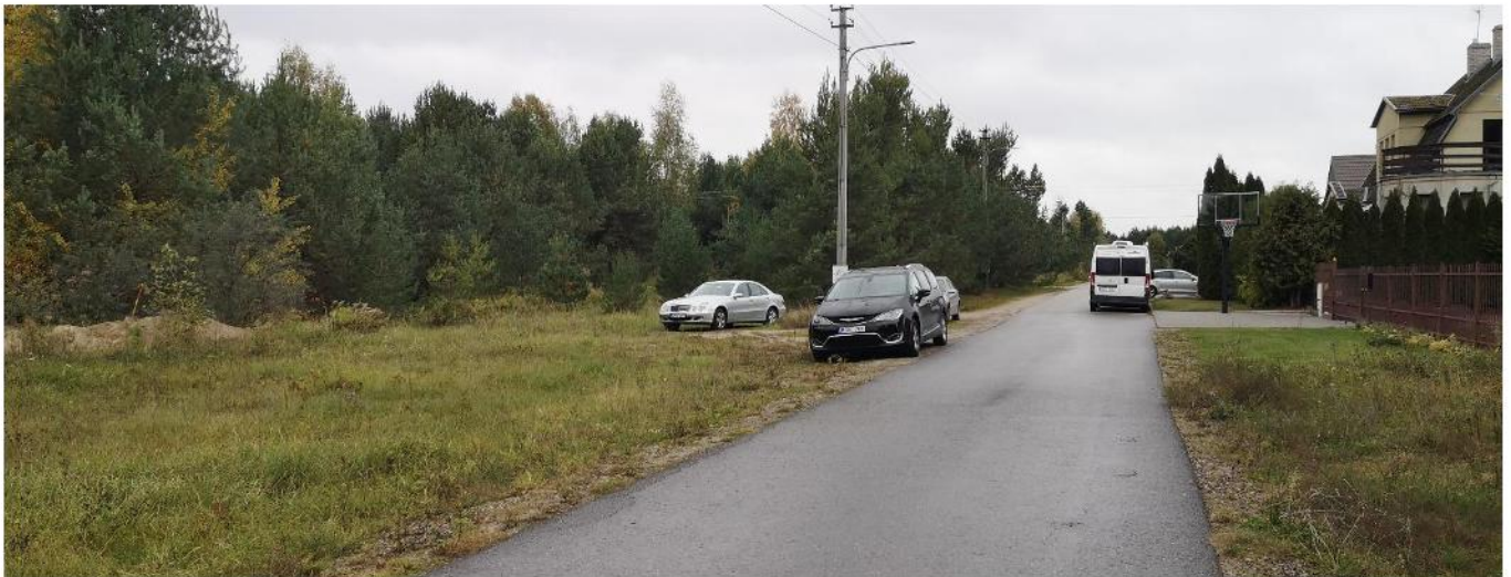
Foto fikscija Nr. 10. Vaidevučio gatvė šiaurės kryptimi