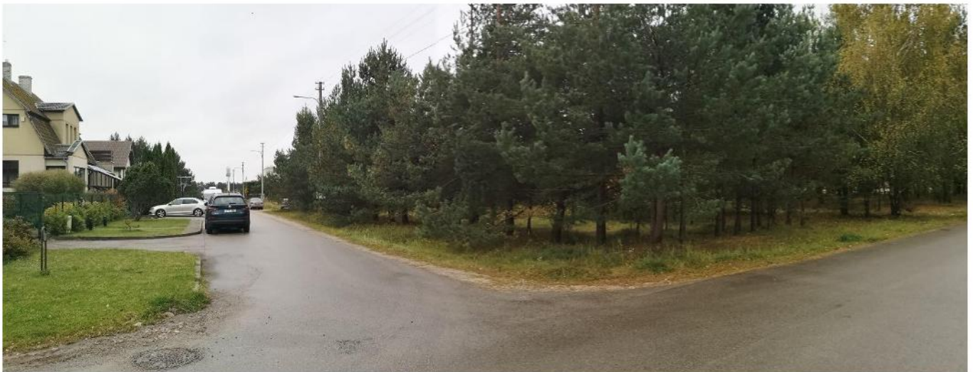
Foto fikscija Nr. 11. Vaidevučio ir Jundos gatvių sankryža pietvakarių kryptimi