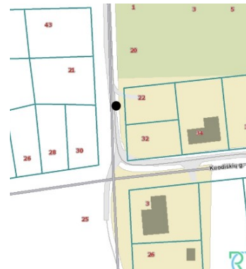
priešgaisrinio hidranto foto vieta pagal regia.lt

Artimiausias priešgaisrinio gelbėjimo pajėgų padalinys – Vilniaus apskrities Priešgaisrinė gelbėjimo valdyba, 4 –oji komanda, Pergalės g. 31, Vilniuje. Atstumas – 3,23 km, atvykimo laikas – 7 min.