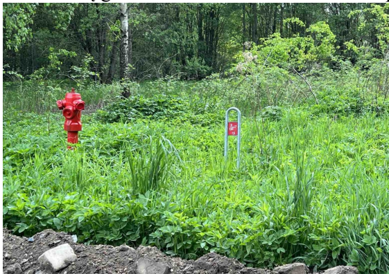
priešgaisrinio hidranto fotofiksacija

Gaisrų gesinimas numatomas nuo esamo priešgaisrinio hidranto ties planuojamais sklypais.