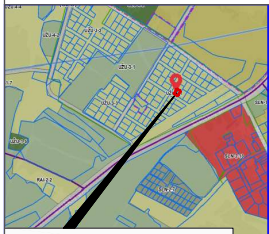
PLANUOJAMA TERITORIJA SITUACIJOS SCHEMA (VILNIAUS M. SAV. TERIT. BP KONTEKSTE)