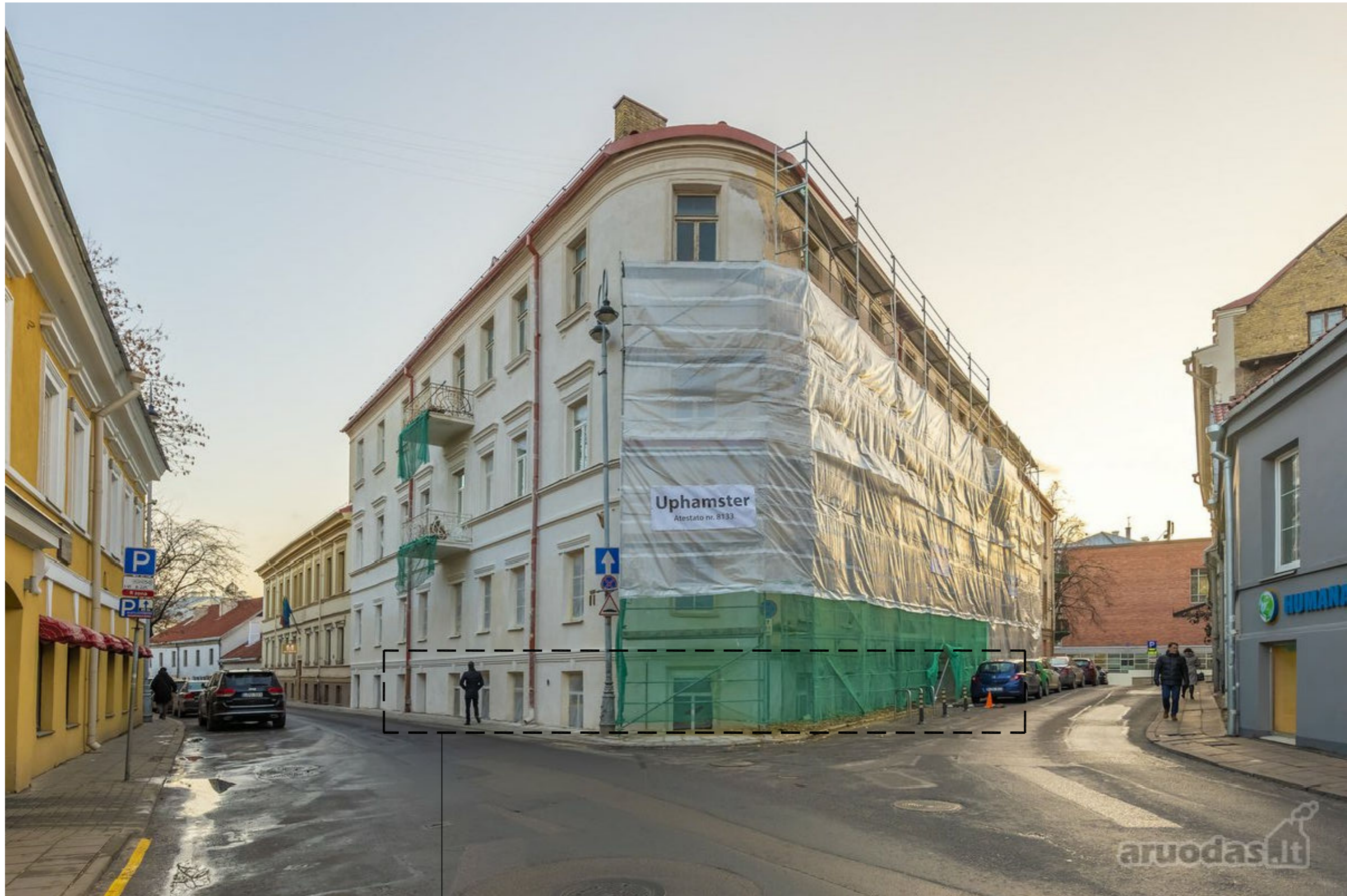
REMONTUOJAMA PASTATO DALIS