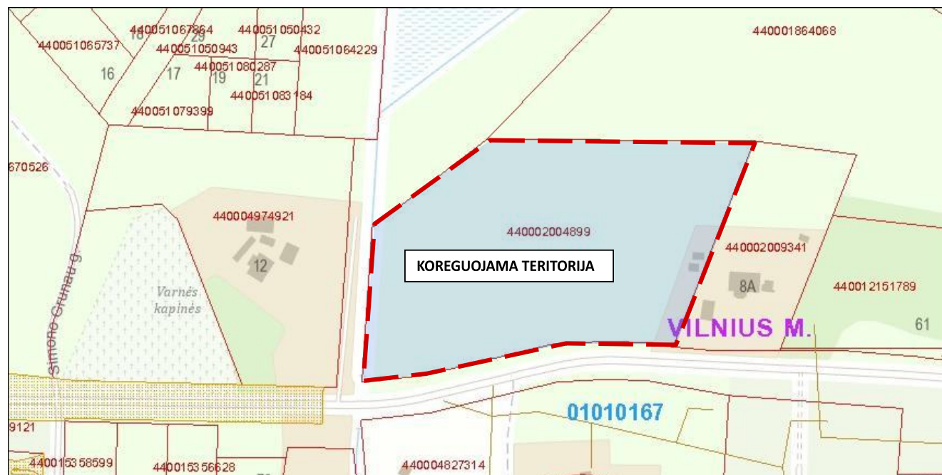
1 pav. Nekilnojamo turto kadastro žemėlapis.