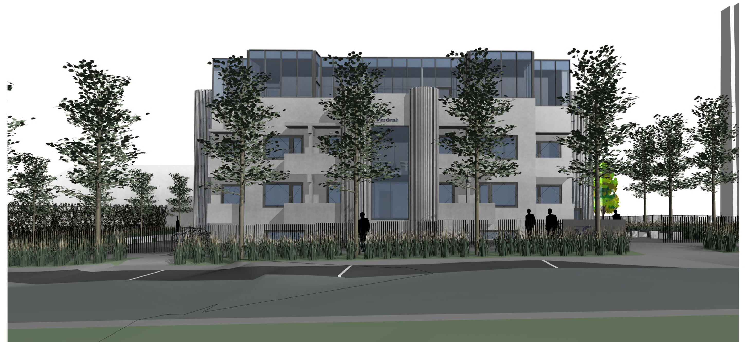
• PASTATO VAIZDAS IŠ ŠIAURINĖS PUSĖS