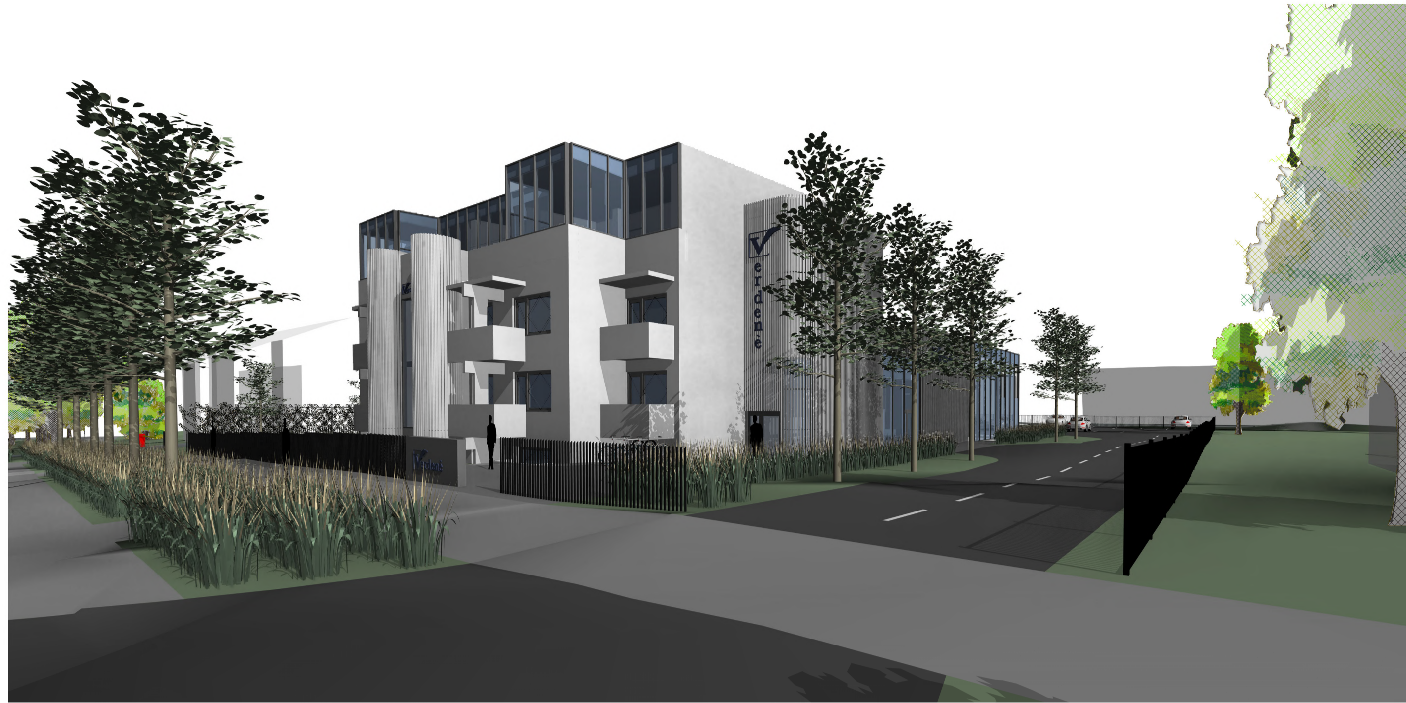
• PASTATO VAIZDAS IŠ ŠIAURĖS VAKARŲ PUSĖS