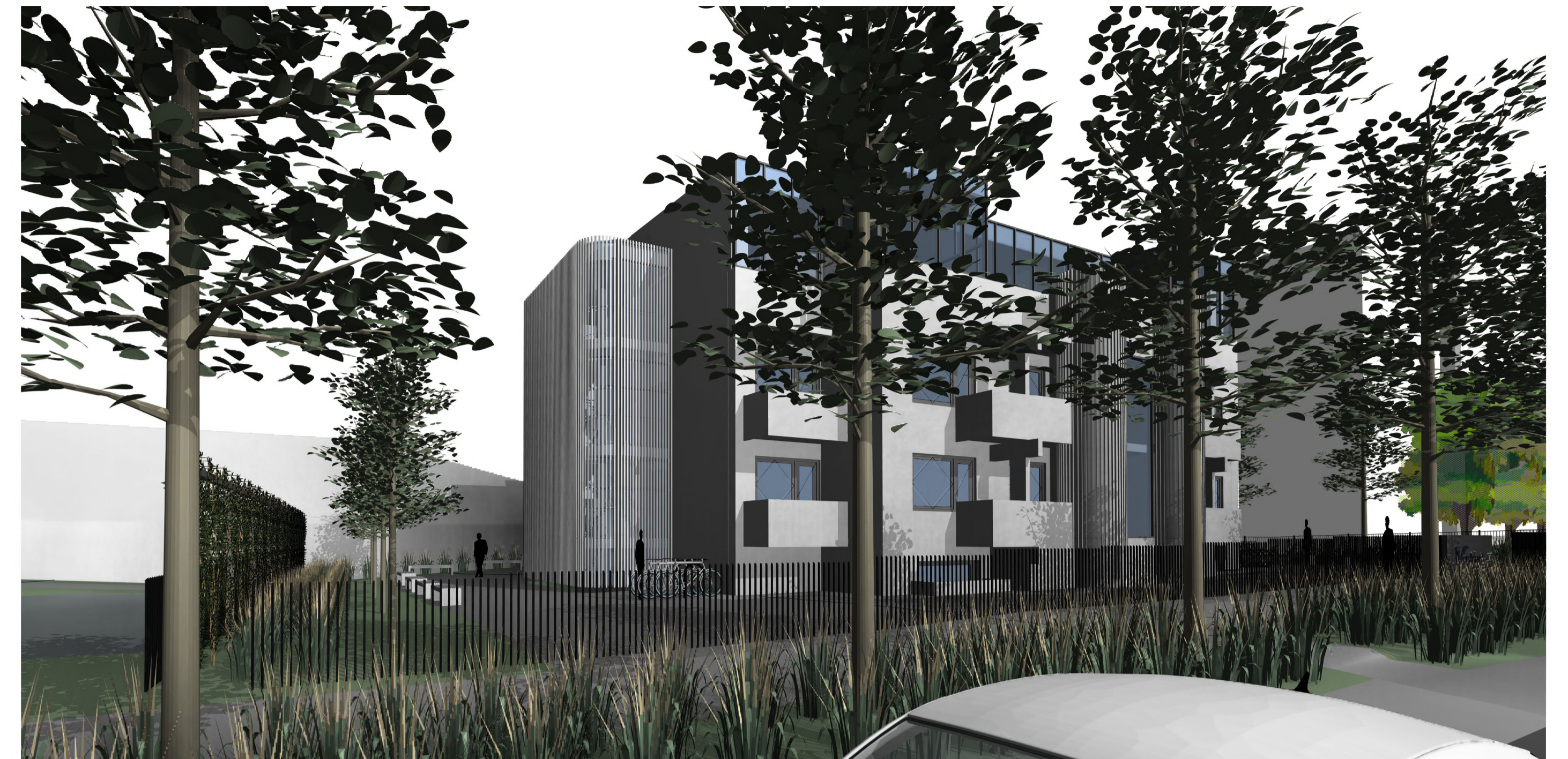
• PASTATO VAIZDAS IŠ ŠIAURĖS RYTŲ PUSĖS