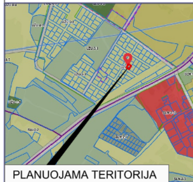
PLANUOJAMA TERITORIJA SITUACIJOS SCHEMA (VILNIAUS M. SAV. TERIT. BP KONTEKSTE)