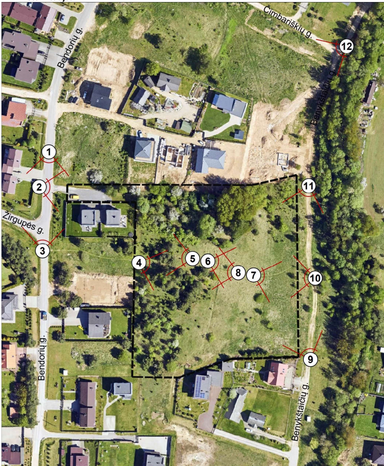
Foto fiksacijų schema