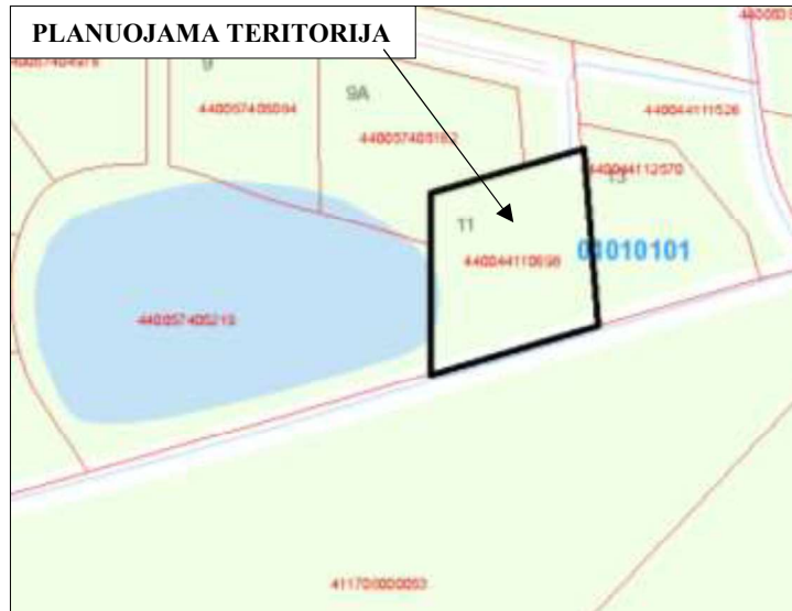
1 pav. Sklypo vieta ir gretimybės. Ištrauka iš www.geoportal.lt

Žemės sklypas, šiaurinėje pusėje ribojasi su žemės sklypu, unik. nr. 4400-5740-8876, rytinėje pusėje su žemės sklypu, unik. nr. 4400-4411-2570, pietinėje pusėje su žemės sklypu, unik. Nr. 4117-0800-0053, vakarinėje pusėje su žemės sklypais, unik. nr. 4400-5740-5219 ir unik. nr. 4400-5740-5162.