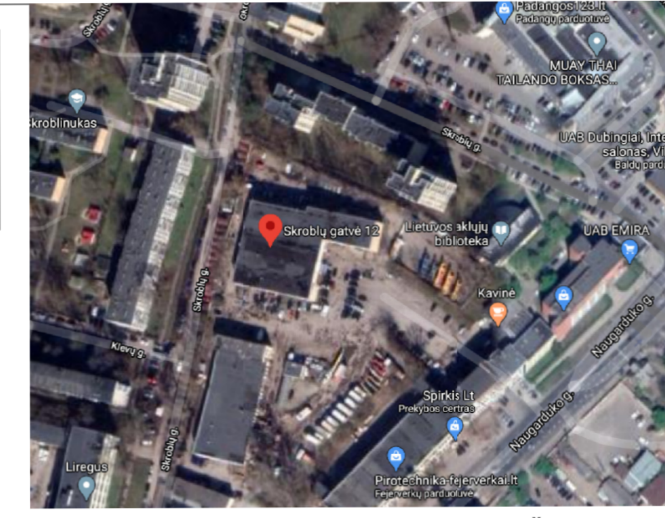
SITUACIJOS SCHEMA SUTARTINIAI ŽENKLAI