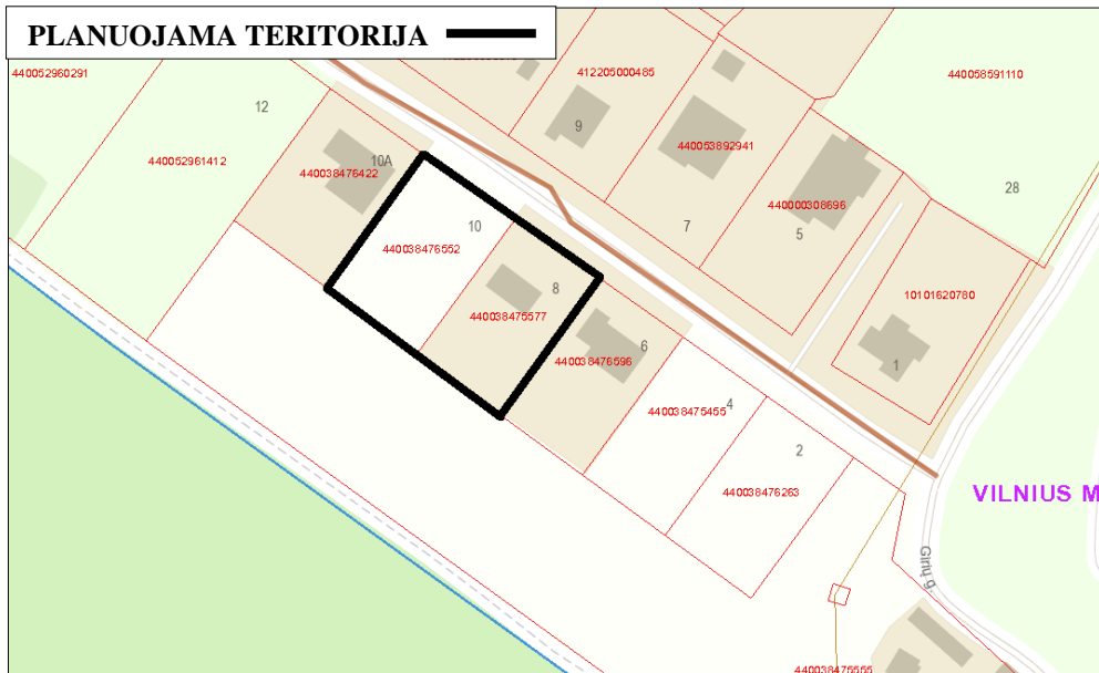
1 pav. Sklypo vieta ir gretimybės.

Žemės sklypas, šiaurinėje pusėje ribojasi su Vaidagų g., rytinėje pusėje ribojasi su žemės sklypu, unik. Nr. 4400-3847-6596, pietinėje pusėje ribojasi su žemės sklypu, unik. Nr. 4400-3847-5555, vakarinėje pusėje ribojasi su žemės sklypu unik. Nr. 4400-3847-6422.