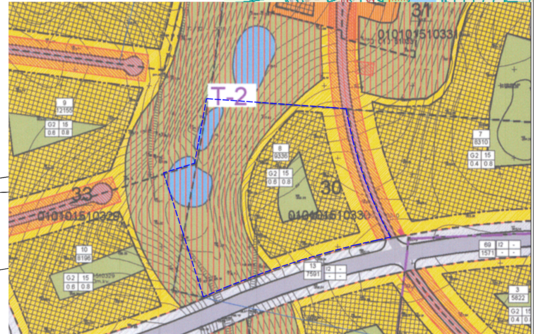
Ištrauka iš „Teritorijos buvusiame Pupojų kaime (Pagal Pupojų rajono urbanistinės plėtros koncepciją, pažymėta indeksais T1, T2, T3, T4, T7, T10, T12, T13) detalusis planas“, patvirtintas 2009 m. gegužės mėn. 21 d. Vilniaus miesto savivaldybės tarybos sprendimu Nr.1-1029. Koreguojama teritorija - sklypas Nr. 8.