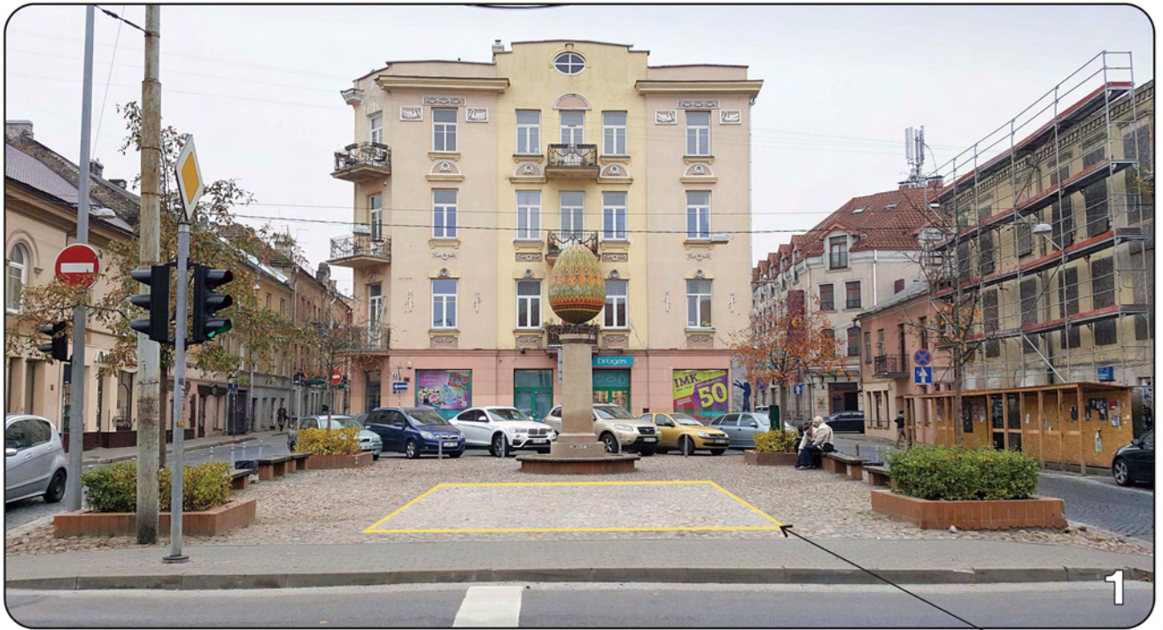
PLANUOJAMA TERITORIJA LAUKO KAVINEI (maksimalus užimamas plotas – 38,6 m 2 ) *