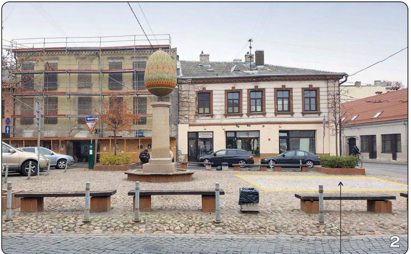
PLANUOJAMA TERITORIJA LAUKO KAVINEI (maksimalus užimamas plotas – 38,6 m 2 ) *

* PASTABA: Lauko kavinės užimamas plotas tikslinamas kavinės projekto apimtyje.