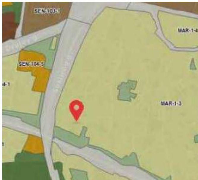
Ištrauka iš Vilniaus miesto savivaldybės bendrojo plano