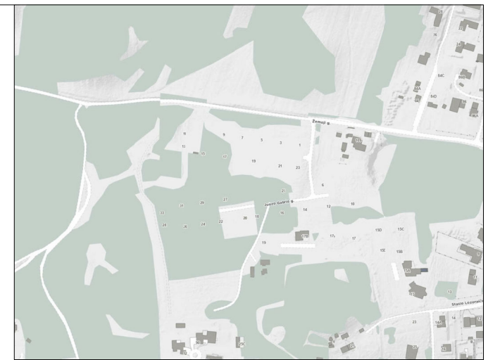
Projektuojamo sklypo vieta