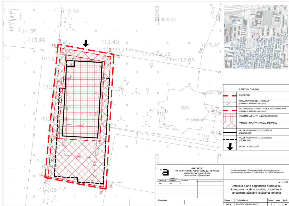
Detaliojo plano korektūros brėžinys