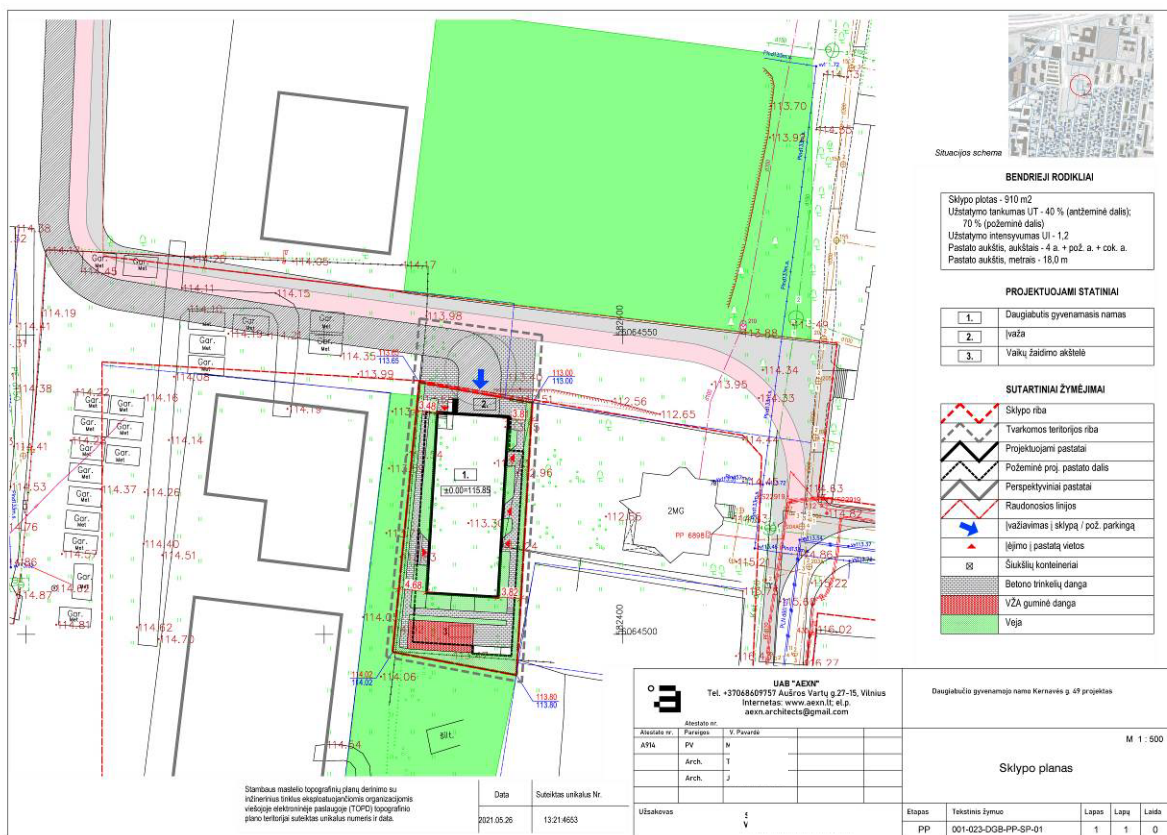
Projektuojamo sklypo plano brėžinys