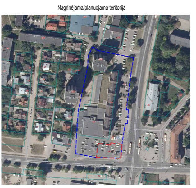
REGLAMENTŲ APRAŠOMOJI LENTELĖ

PASTABOS: I. Vadovaujantis Vilniaus miesto bendrojo plano aiškinamojo rašto sprendiniais, pastatų aukštis skaičiuojamas įskaitant cokolinius, mansardinius aukštus bei antstatus, antresoles. II. Rengiant statinių statybos projektus, privalo būti užtikrinamos natūralaus apšvietimo sąlygos planuojamiems ir esamiems pastatams, vaikų žaidimų aikštelėms, numatant juose normalyvinę insoliacijos trukmę. III. Statinių statyba be gretimų žemės sklypų savininkų rašytinio sutikimo galima tik vadovaujantis STR 1.05.01:2017 „Statybą leidžiantys dokumentai, Statybos užbaigimas, Statybos sustabdymas. Savivaldiškos statybos padarinių šalinimas. Statybos pagal neteisėtai išduotą statybą leidžiantį dokumentą padarinių šalinimas“ 7 priede numatytais atvejais.