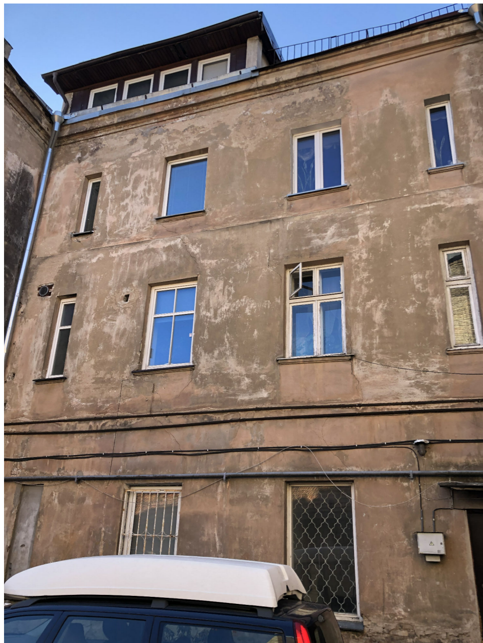
Daugiabučio gyvenamojo namo adresu Ligoninės g. 2, Vilniuje, neįrengtos pastogės paskirties keitimas į gyvenamąją (butą), kapitalinio remonto projektas