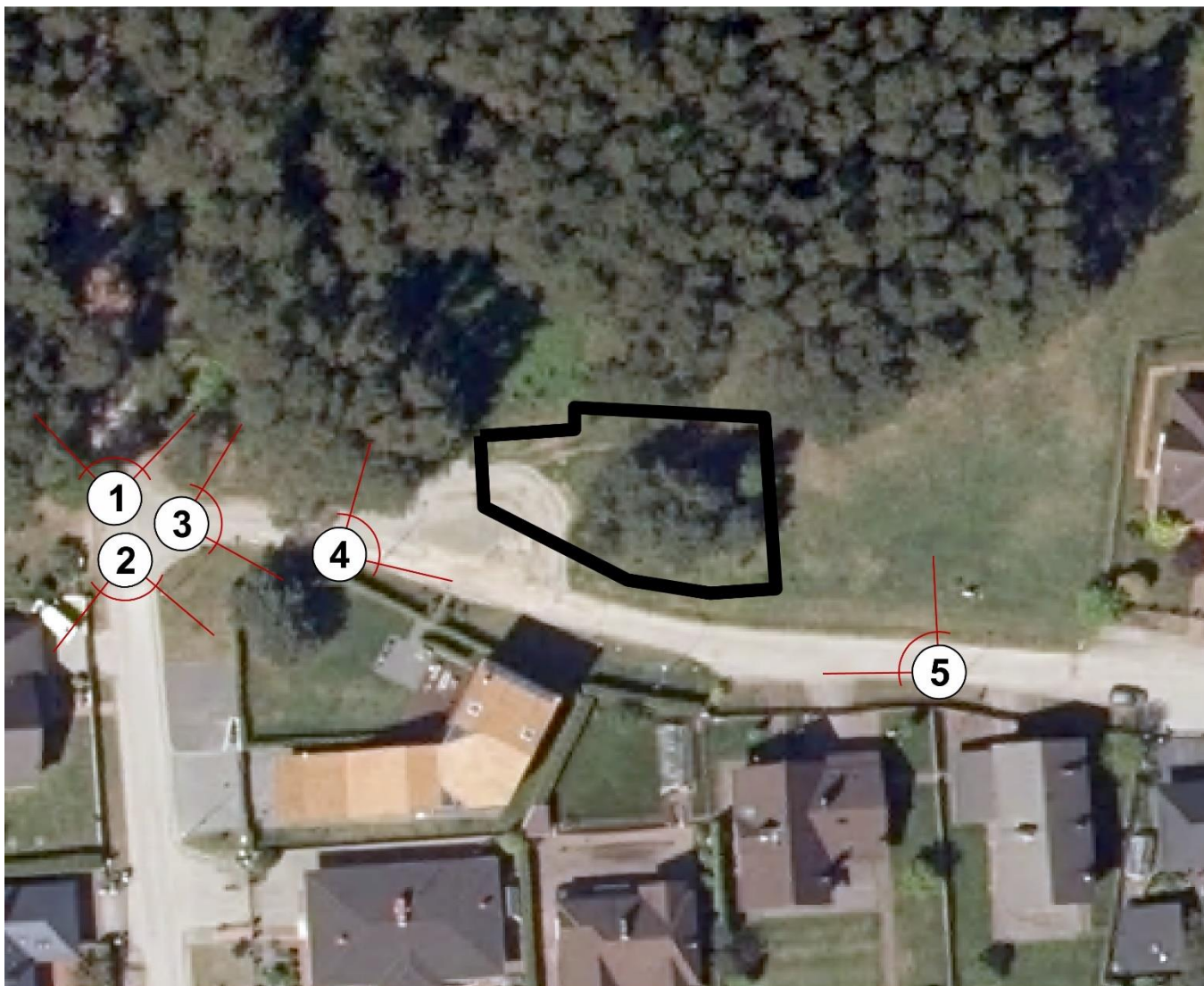
Foto fiksacijų schema