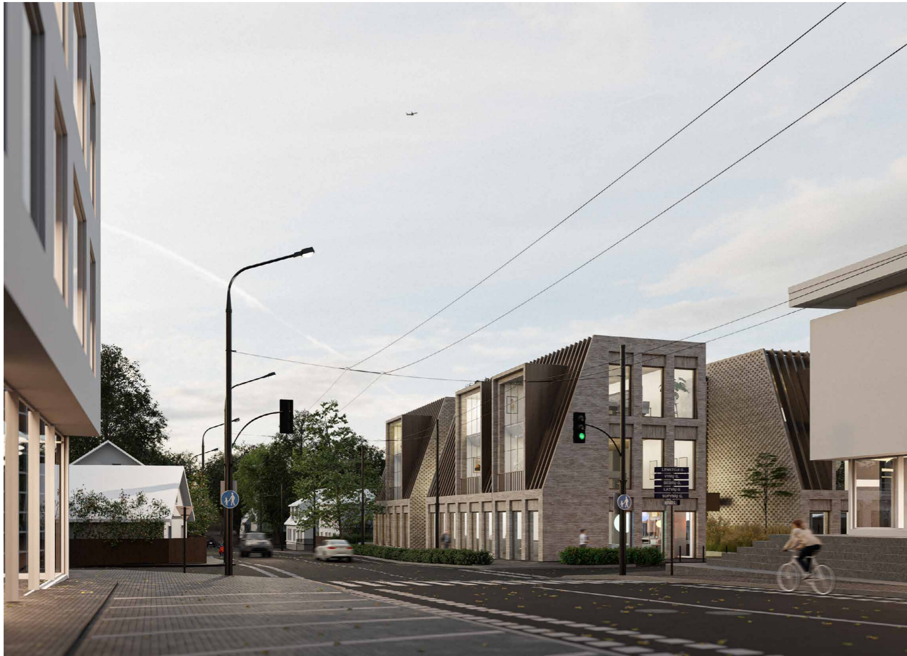
VAIZDAS IŠ KĖSTUČIO GATVĖS | ŠIAURINĮ FASADĄ*