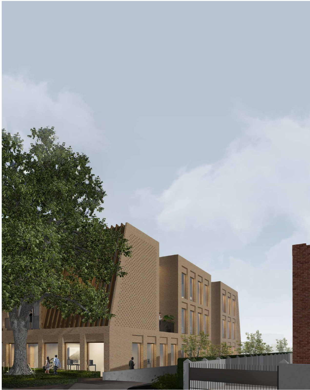
VAIZDAS IŠ LENKTOSIOS GATVĖS | VAKARINĮ FASADĄ