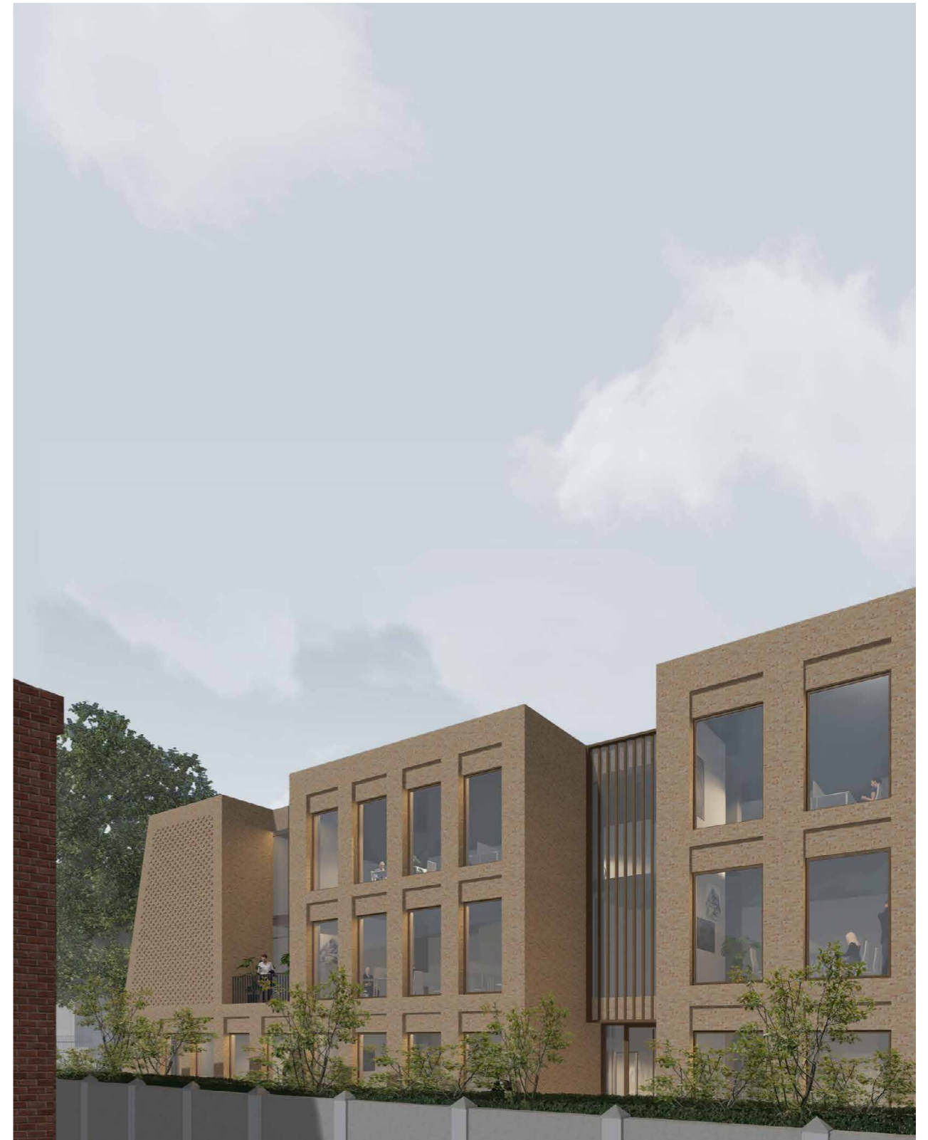
VAIZDAS | VAKARINĮ FASADĄ IŠ LENKTOJI G. 36 KIEMO