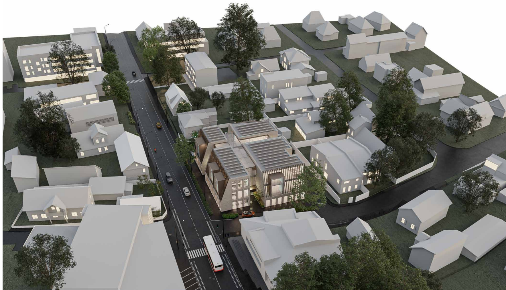
VAIZDAS | PROJEKTOJAMĄ PASTATĄIŠ VIRŠAUS*