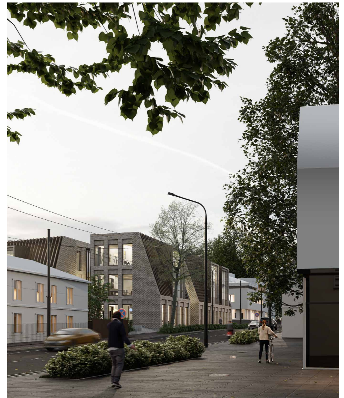
VAIZDAS IŠ KĘSTUČIO GATVĖS | PIETINĮ FASADĄ*

Pastabos: 1. Visi sprendiniai tikslinami techninio projekto metu; 2. Sklypas patenka į Vilniaus senamiesčio (kodas 16073) vizualinės apsaugos pozonį;