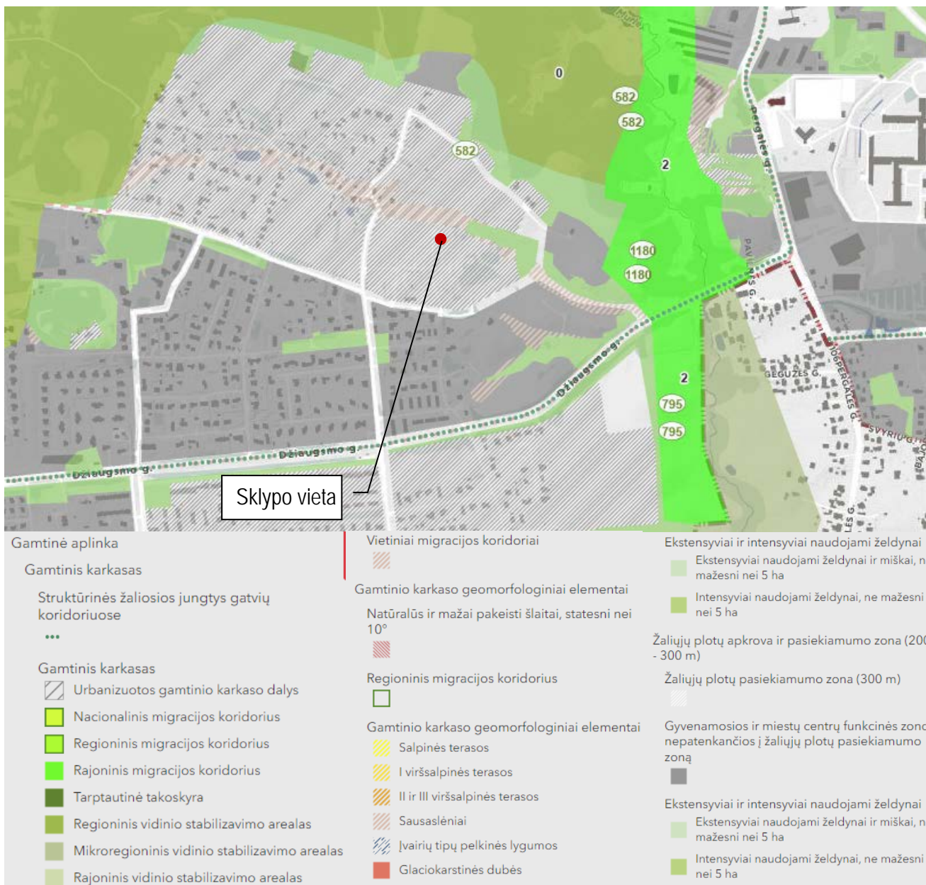
Pav.3. BENDRASIS PLANAS. Gamtinis karkasas

Pagal 2013-07-24 Vilniaus miesto savivaldybės tarybos sprendimu Nr. 1-1407 patvirtintą Apie 29,6 ha ir 2,3 ha teritorijų šalia Džiaugsmo ir Strielčiųų gatvių detalų planą sklypo naujinimo būdas yra vienbučių ir dvibučių gyvenamųjų pastatų teritorijos, užstatyti leidžiamas plotas 29 proc., intensyvumas 0,4, o pastatų aukštumas – nuo 1 iki 3 aukštų (iki 10,0 m nuo žemės paviršiaus), įskaitant mansardiną, priklausomųjų želdynų plotas – 25 proc.