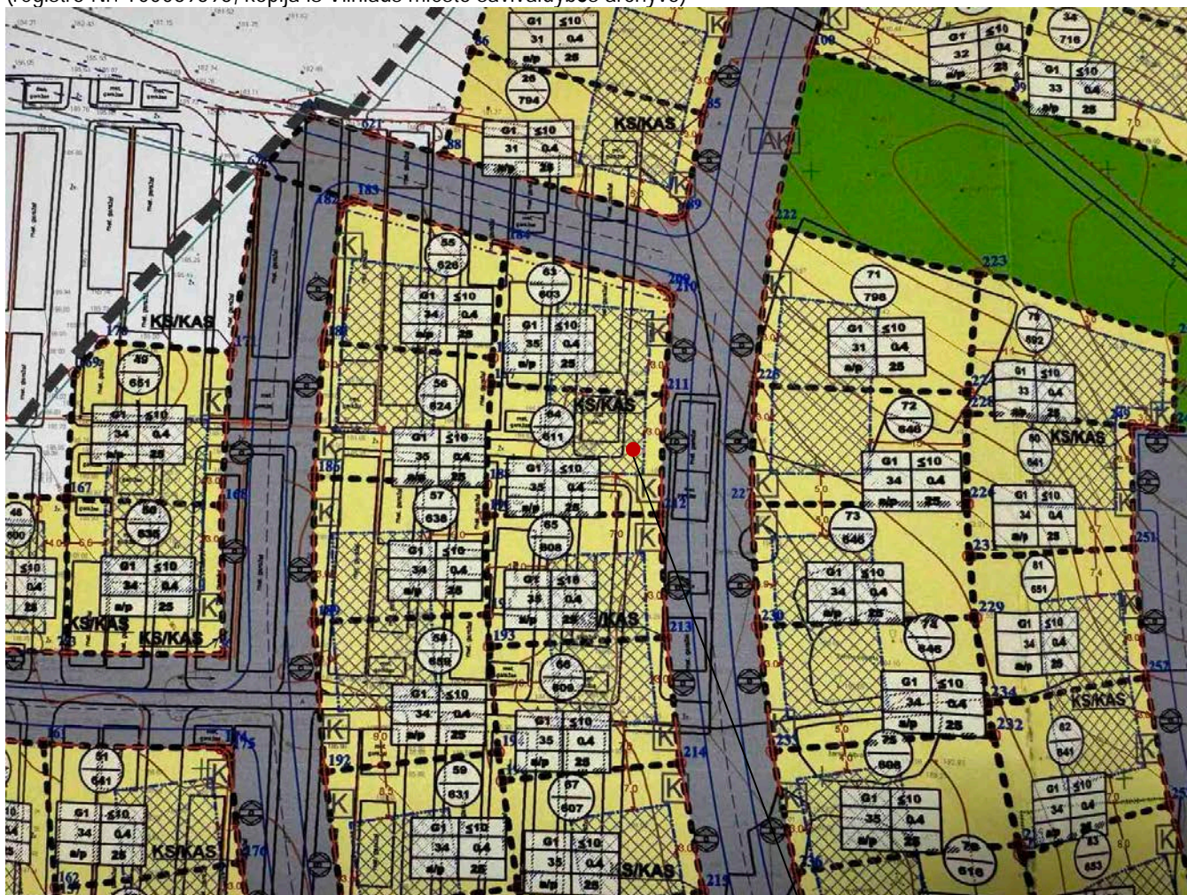
Pav.4. Apie 29,6 ha ir 2,3 ha teritorijų šalia Džiaugsmo ir Strielčiųų gatvių detaliuojo plano ištrauka (registro Nr. T00069595, kopija iš Vilniaus miesto savivaldybės archyvo)

APIE 29,6 HA IR 2,3 HA TERITORIJŲ ŠALIA DŽIAUGSMO IR STRIELČIUKŲ GATVIŲ DETALIOJO PLANO, SKLYPO NR. 64 (JONO VAILOKAIČIO G. 26, VILNIAUS M., KAD. NR. 0101/0063:674), SPRENDINIŲ KOREGAVIMAS, KOREGUOJANT STATYBOS ZONĄ IR RIBĄ