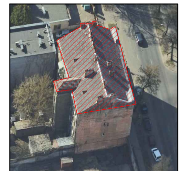
Šiaurinio fasado fotofiksacija