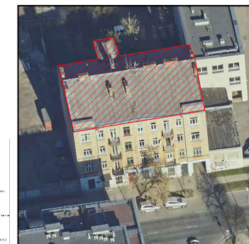
Vakarinio fasado fotofiksacija