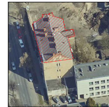
Pietinio fasado fotofiksacija