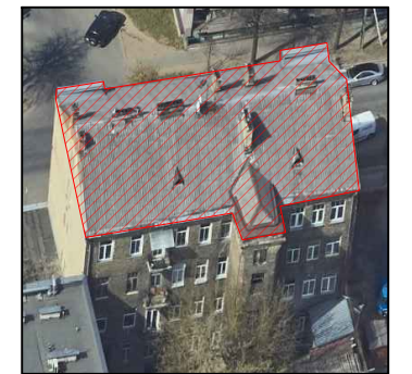
Rytinio fasado fotofiksacija