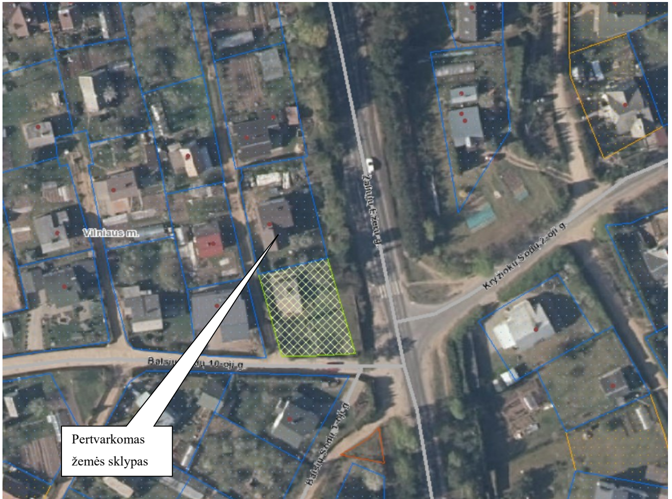
2 pav. Žemės sklypo gretimybės schema