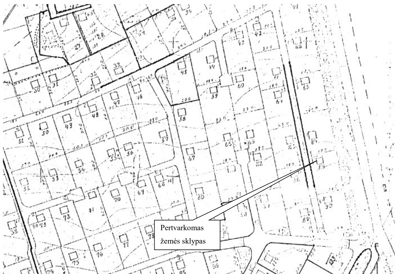
1 pav. Sodininkų bendrijos „Tulpė-1“ genplano ištrauka

4.1. Žemės sklypas, kuriam rengiamas formavimo ir pertvarkymo projektas yra Balsių Sodų 10-ojoje gatvėje 3, sodininkų bendrijoje „Tulpė-1“ (žiūr. 1 pav.), Vilniaus miesto savivaldybėje.