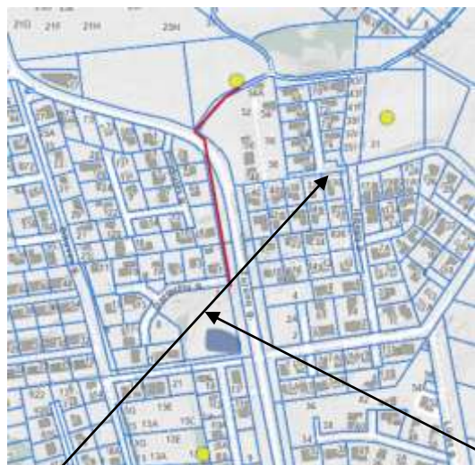
Ø Gaisrinis hidrantas pav.3 Planuojama teritorija