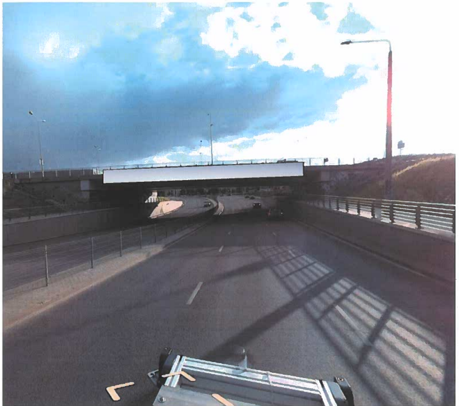
Vaizdas nuo Ateities g. vakarų kryptimi