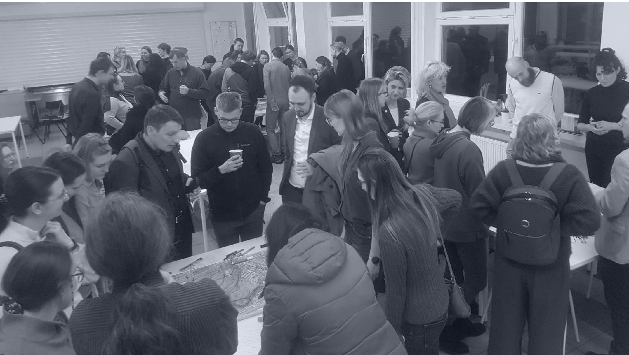
Jomanto parko vizijos kūrimo kūrybinių dirbtuvių akimirka, 2023-03-01 Vilnius