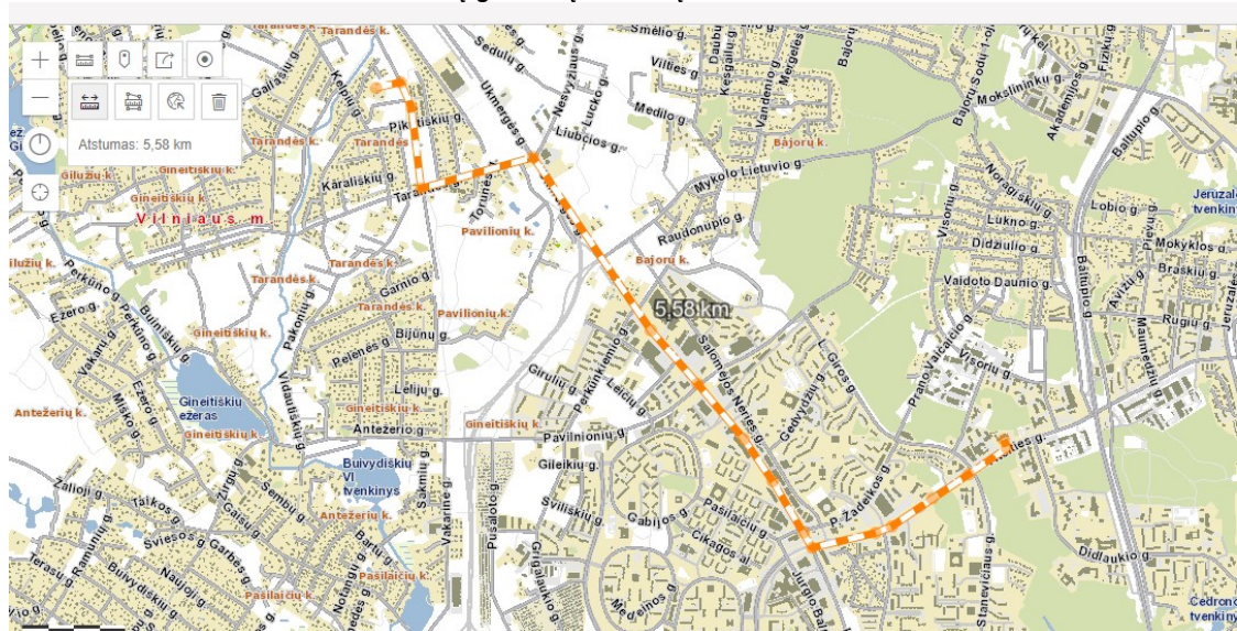
Maršrutas iki artimiausios priešgaisrinės gelbėjimo tarnybos 3-osios komandos

Artimiausia Priešgaisrinės gelbėjimo pajėgos yra Vilniaus m. priešgaisrinės gelbėjimo tarnybos 3-oji komanda (Ateities g. 17) nutolusi ~5,6 km atstumu.