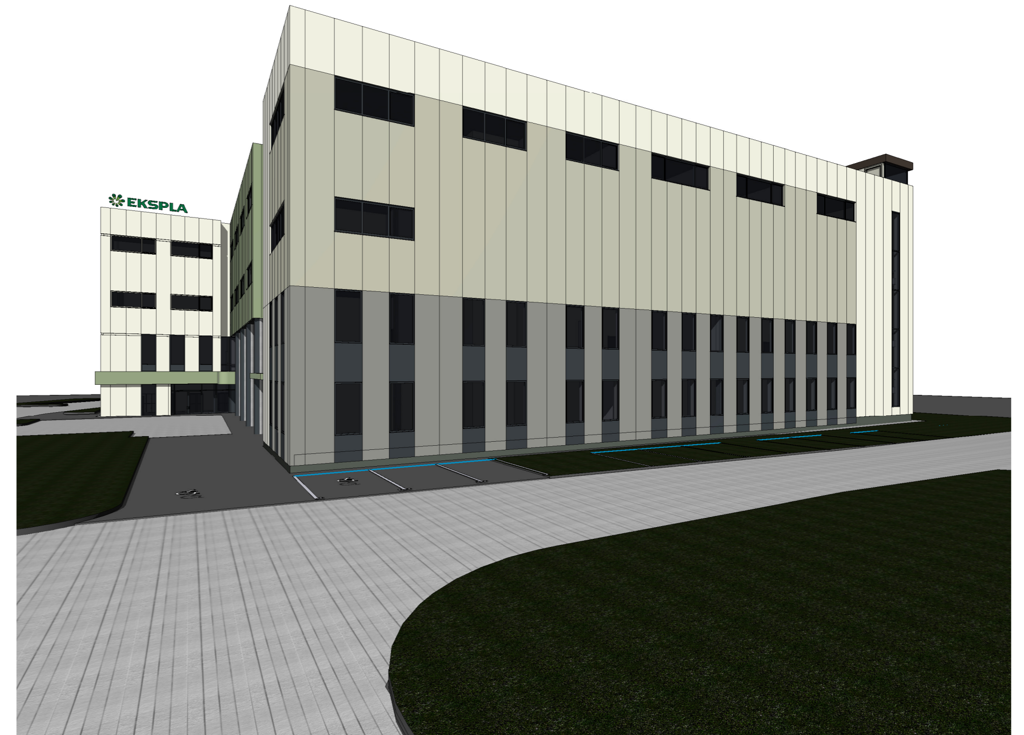
1 Nuo įvažiavimo pusės