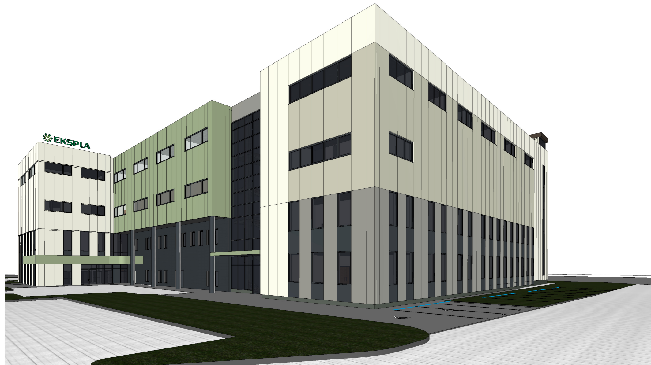
2 Iš pagrindinio kiemo pusės