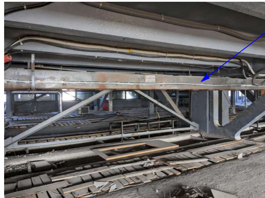
Esamos patalpos foto