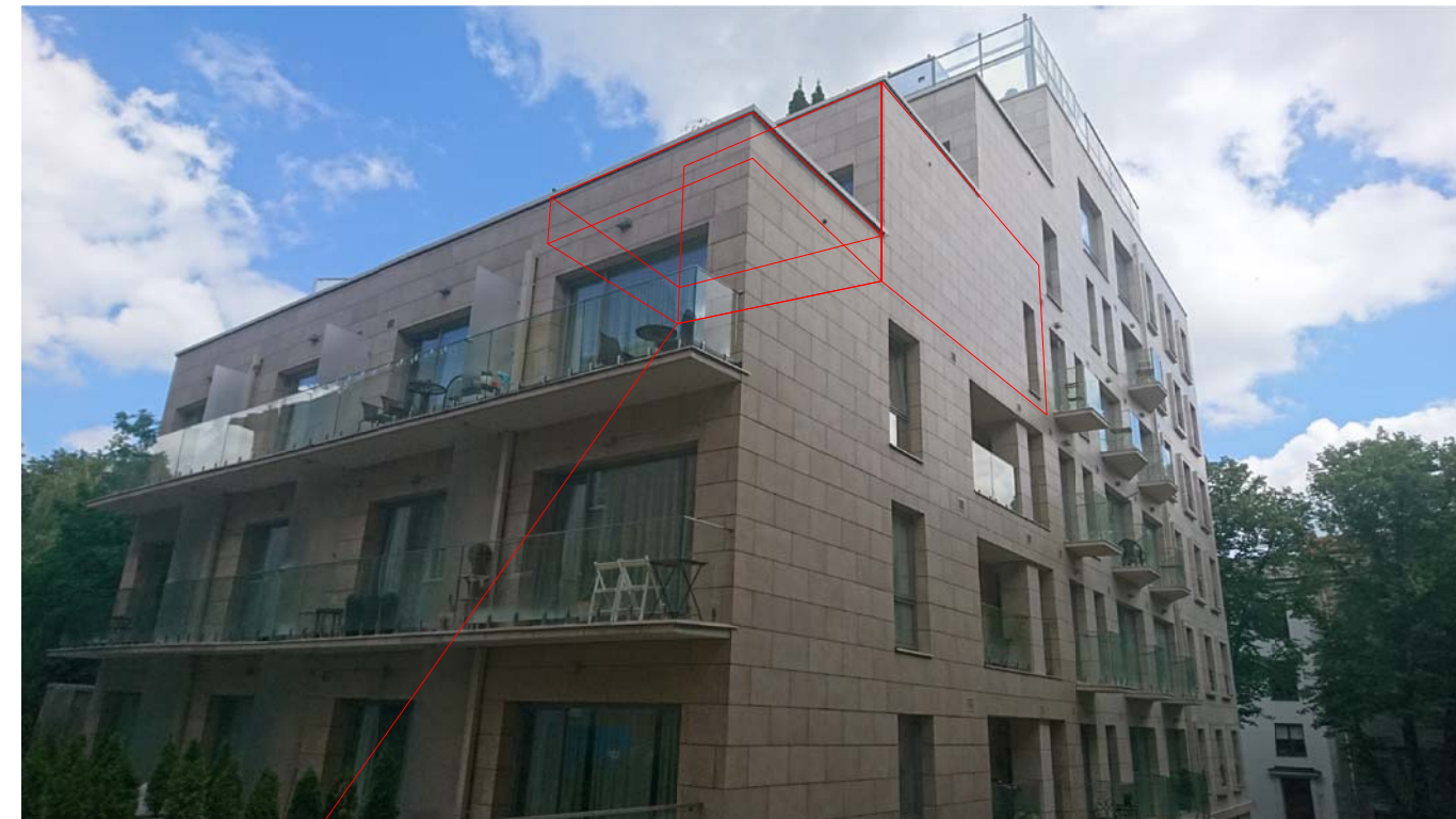
PATALPŲ NR. 46 VIETA