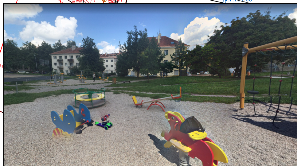
Vaikų žaidimų ir sporto aikštelės