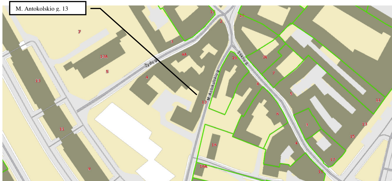
1 pav. Ištrauka iš www.regia.lt žemėlapiu

Bendras patalpų plotas 42,80 m 2 (esamas), pagrindinis plotas 21,00 m 2 (esamas)