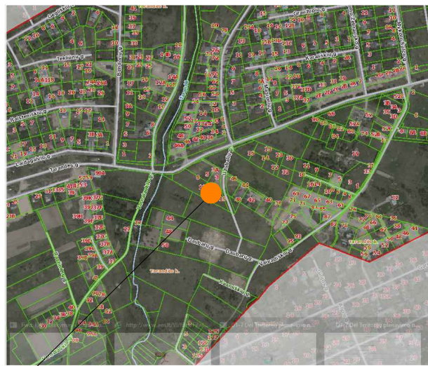
PLANUOJAMA TERITORIJA SITUACIJOS SCHEMA