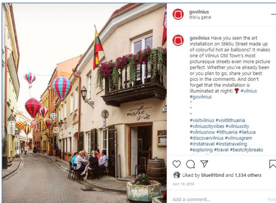
Pav. 2.2. Stiklių gatvės instaliacija

Stiklių gatvės instaliacija „The Balloons“ tapo fotogeniškiausia ir pačia populiariausia Vilniaus miesto gatvė socialiniuose tinkluose, ypač „Instagram“ kanale. Visą instaliacijos gyvavimo laikotarpį turistai aktyviai teiravosi informacijos apie ją „Go Vilnius“ socialiniuose tinkluose bei aktyviai žymėjo „Go Vilnius“ „Instagram“ profilį keldami turinį į savo asmenines paskyras. Šios instaliacijos nuotraukomis aktyviai dalinosi ir kitos užsienio „Instagram“ paskyros, tokios kaip theMagger.com, turinti 225 tūkst. „Instagram“ sekėjų. Stiklių gatvės instaliacija sugeneravo daugybę turinio socialiniuose tinkluose, buvo aktyviai lankoma tiek Lietuvos piliečių, tiek užsieniečių ir tapo bene labiausiai matoma Vilniaus miesto lokacija socialiniuose tinkluose 2019 m. (žr. pav. 2.2.).