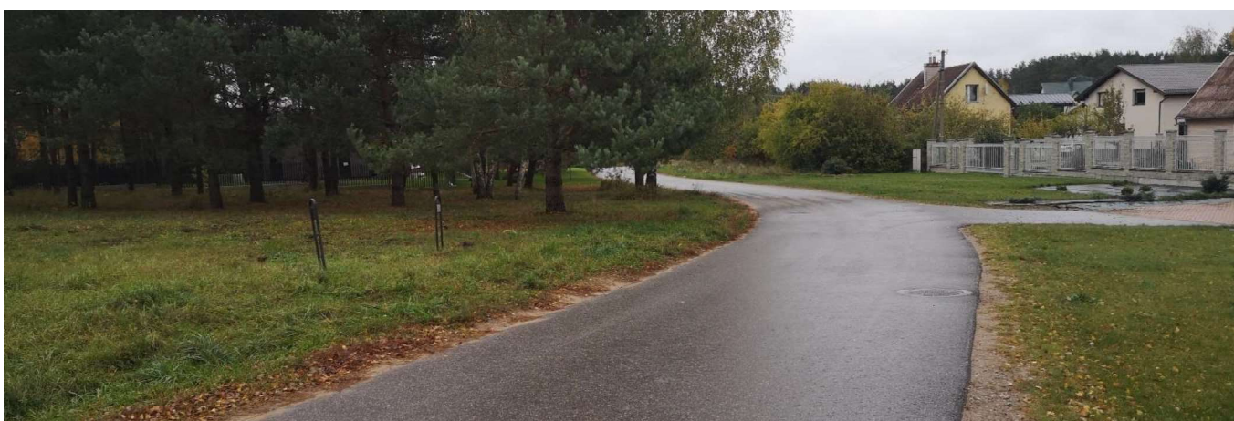
Foto fiksacija Nr. 6. Bulvicio gatvė rytų kryptimi