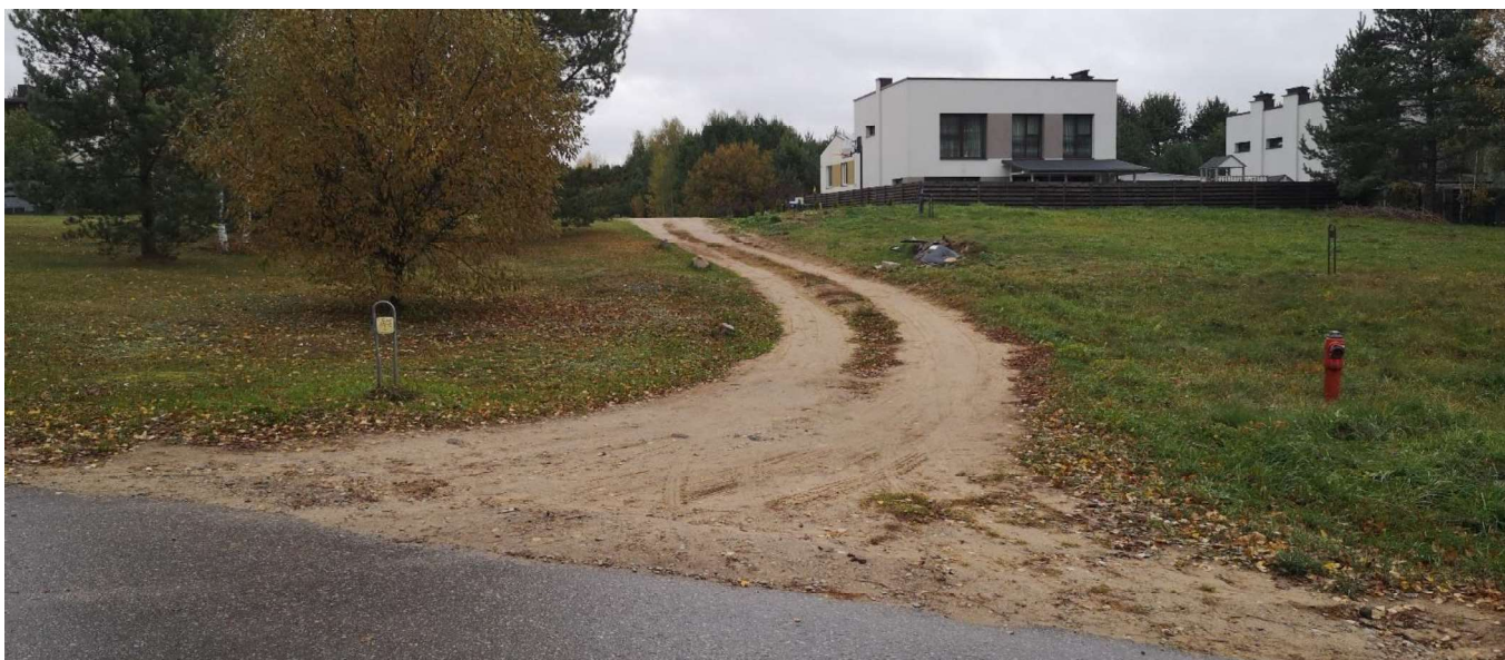
Foto fiksacija Nr. 5. Aušrinės gatvės sankryža su Bulvicio gatve šiaurės kryptimi