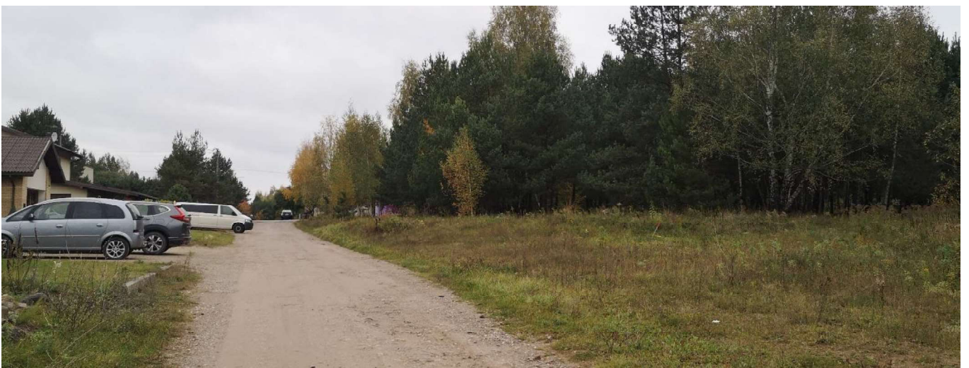
Foto fiksacija Nr. 3. Aušrinės gatvė šiaurės kryptimi