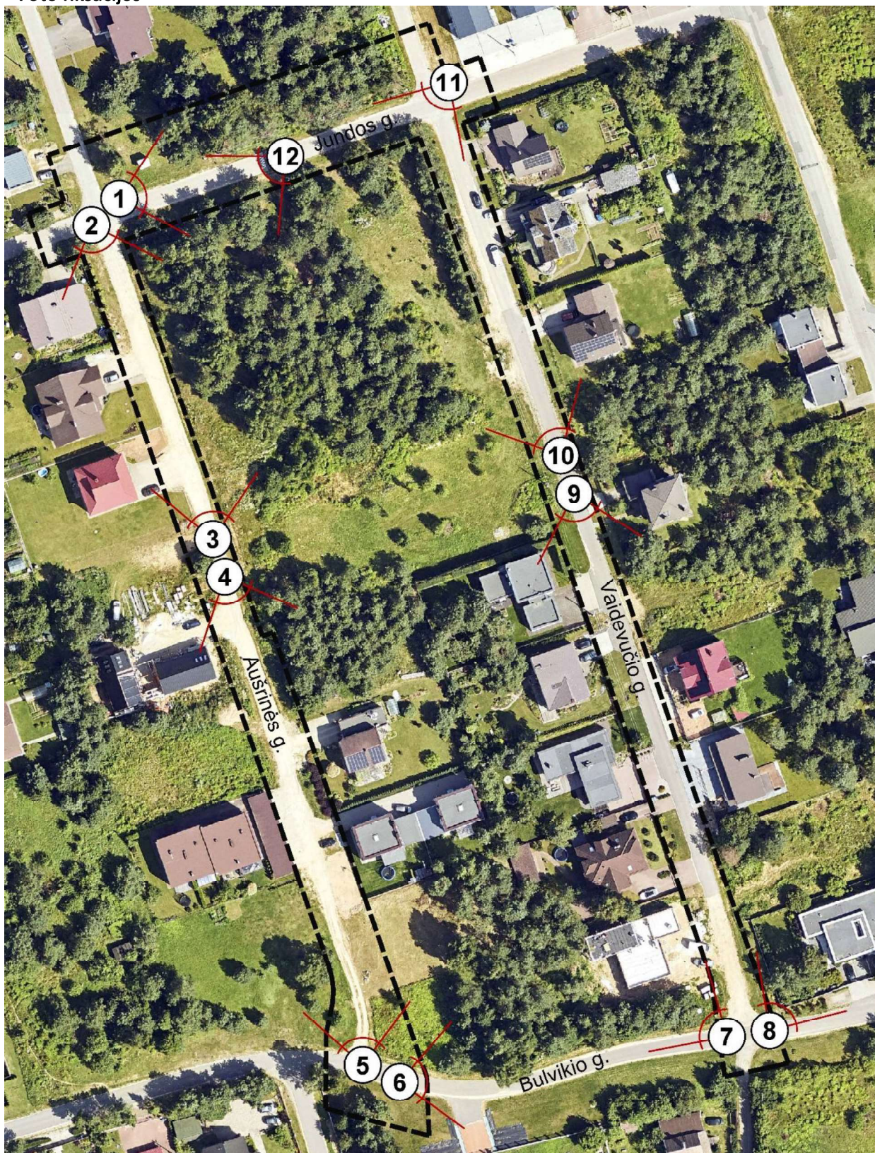
Foto fiksacijų schema