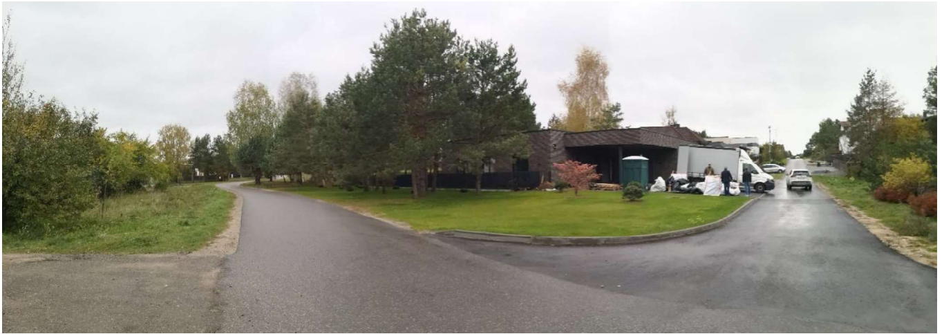
Foto fikscija Nr. 7. Vaidevučio ir Bulvikio gatvių sankryža šiaurės vakarų kryptimi