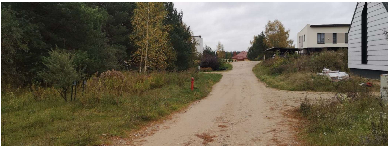
Foto fiksacija Nr. 4. Aušrinės gatvė pietų kryptimi