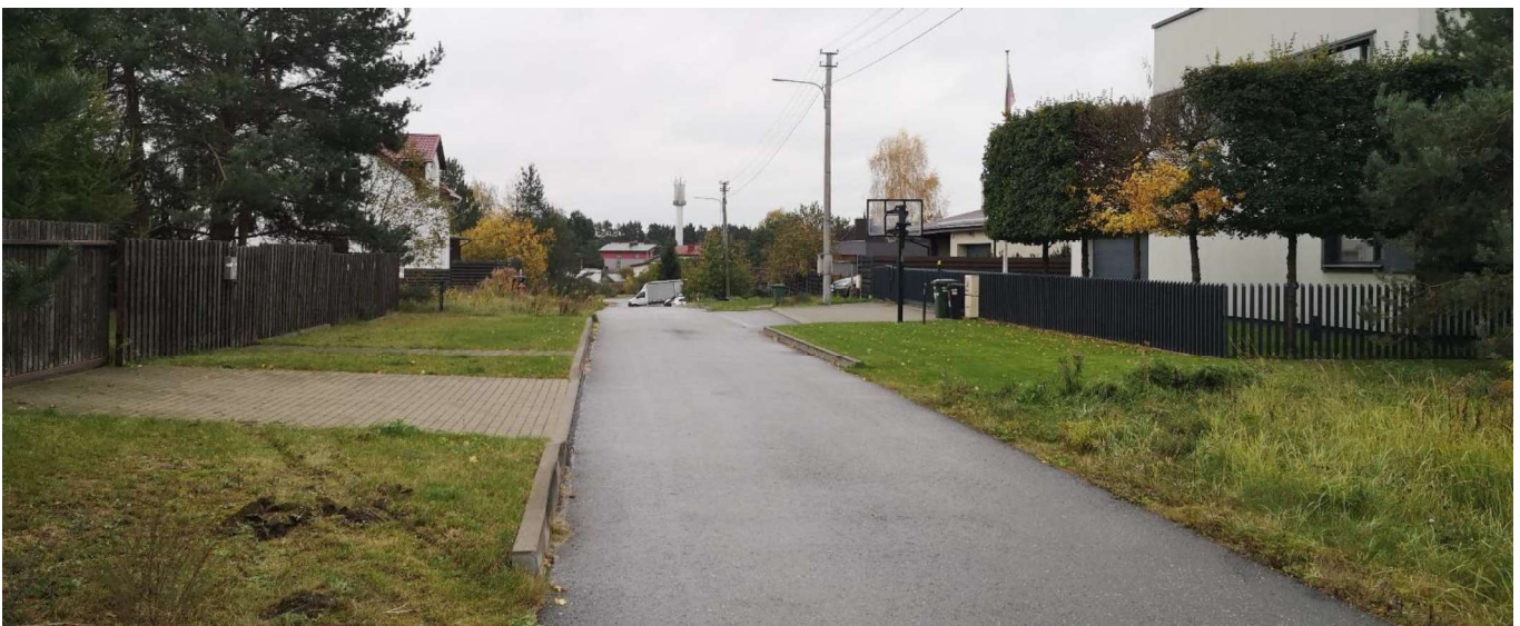
Foto fikscija Nr. 9. Vaidevučio gatvė pietų kryptimi