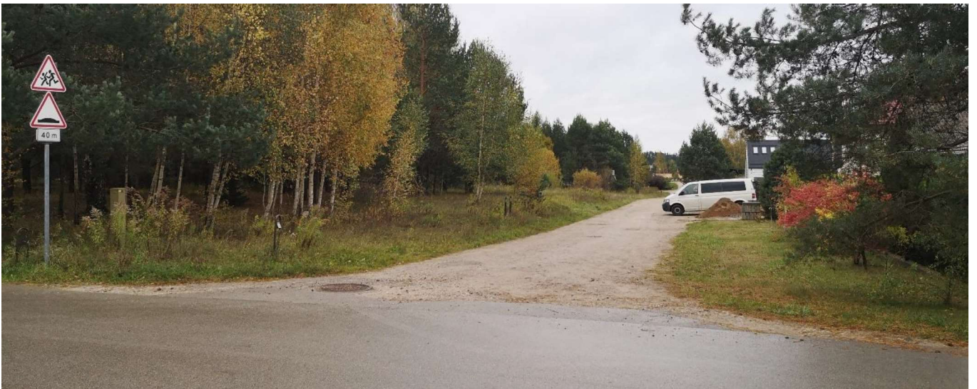
Foto fiksacija Nr. 2. Aušrinės gatvės sankryža su Jundos gatve pietų kryptimi