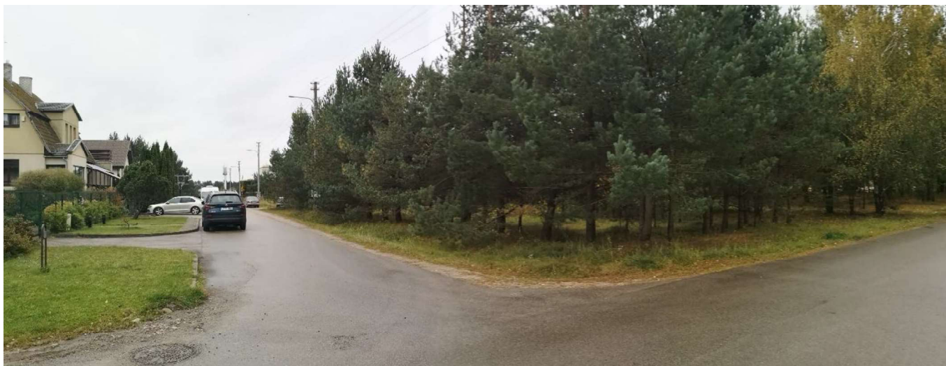
Foto fiksacija Nr. 11. Vaidevučio ir Jundos gatvių sankryža pietvakarių kryptimi