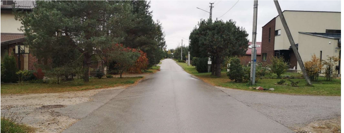
Foto fiksacija Nr. 1. Jundos gatvės sankryža su Aušrinės gatve rytų kryptimi