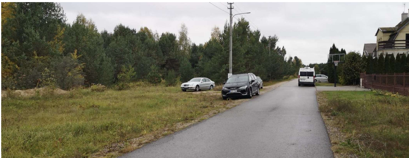
Foto fiksacija Nr. 10. Vaidevučio gatvė šiaurės kryptimi