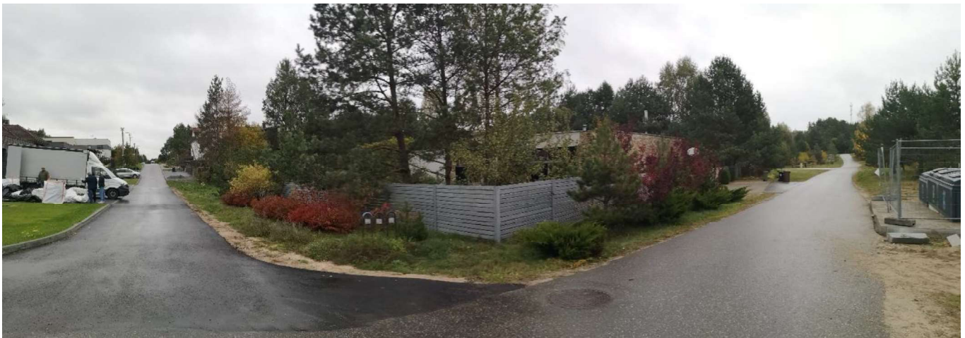
Foto fikscija Nr. 8. Vaidevučio ir Bulvikio gatvių sankryža šiaurės rytų kryptimi