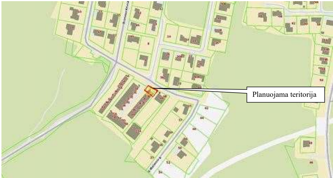
1 pav. Planuojamos teritorijos vieta