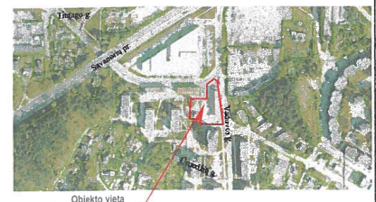
Sklypo vieta koreguojamame detaliojame plane