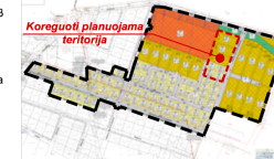
Detaliojo plano koregavimas 2018 m.