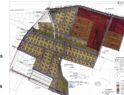
Detaliojo plano koregavimas 2013 m.

Planavimo tikslai ir uždaviniai: Atlikti iniciuoti Vilniaus miesto savivaldybės tarybos 2013 m. rugšpio 25 d. sprendimu Nr. 1-1474 „Dėl apie 30 ha teritorijos tarp Ašmenėlės ir Juodupio gatvių detaliojo plano tvirtinimo“ patvirtinto apie 30 ha teritorijos tarp Ašmenėlės ir Juodupio gatvių, Naugos Vilmos seniūnijoje, detaliojo plano (reg. Nr. T00069806), pakoreguoto Vilniaus miesto savivaldybės administracijos direktoriaus pavaduotojo 2018 m. balandžio 3 d. įsakymu Nr. A30-795/18(2.1.22E-TD2) „Dėl apie 30 ha teritorijos tarp Ašmenėlės ir Juodupio gatvių detaliojo plano sprendinių koregavimo apie 13,4 ha teritorijos dalyje tvirtinimo“, sprendinių koregavimo planavimo proceso inicijavimo sutarties pagrindu, keičiant (nustatant) apie 0,8 ha teritorijos dalyje sklypuose (kad. Nr. 0101/0158-2226, Nr. 0101/0158-2227, Nr. 0101/0158-2228, Nr. 0101/0158-2273, Nr. 0101/0158-2274, Nr. 0101/0158-2275 ir Nr. 0101/0158-2276) žemės sklypų ribas ir plotus, žemės naudojimo būdą (komercinės paskirties objektų teritorijos), užstatymo tankį, intensyvumą, statinio aukštį, užstatymo tipą, statybos zoną ir ribą bei kitus planuojamam užstatymui reikalingus teritorijos naudojimo reglamentus, vadovaujantis Vilniaus miesto savivaldybės teritorijos bendrojo plano sprendiniais.