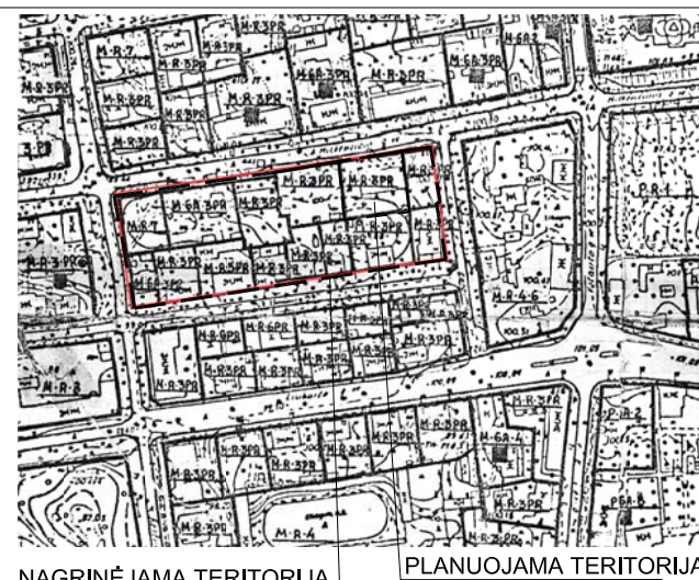
NAGRINĖJAMA TERITORIJA PLANUOJAMA TERITORIJA