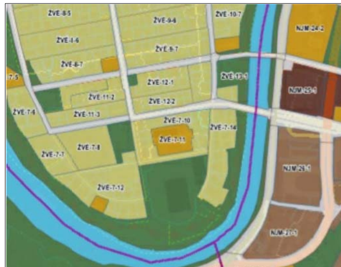
Ištrauka iš Vilniaus miesto savivaldybės teritorijos bendrojo plano pagrindinio brėžinio iki 2030