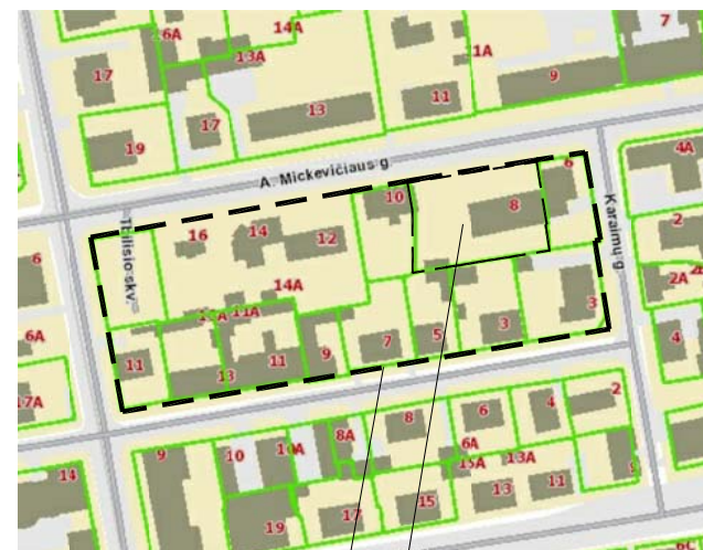
NAGRINĖJAMA TERITORIJA PLANUOJAMA TERITORIJA