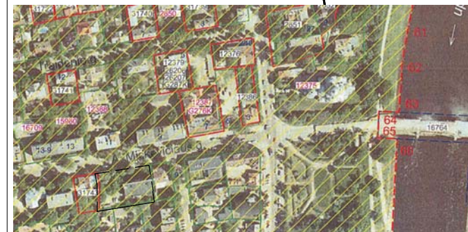
Ištrauka iš Vilniaus miesto istorinės dalies, vad. Žvėrynu, apibrėžtų teritorijos ribų plano