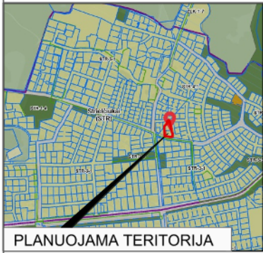
PLANUOJAMA TERITORIJA SITUACIJOS SCHEMA (VILNIAUS M. SAV. TERIT. BP KONTEKSTE)