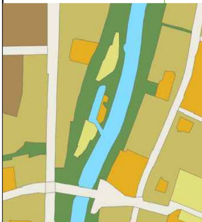
SITUACIJOS SCHEMA VILNIAUS M. SAV. TERIT. BP SPRENDINIUIOSE