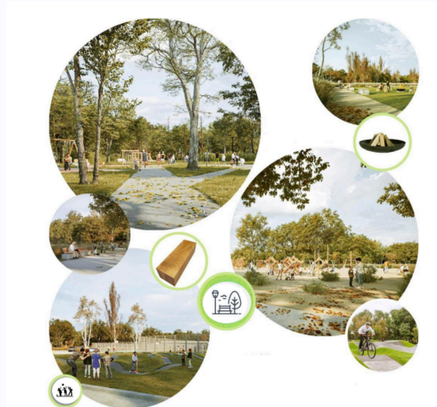
SALININKŲ „GAMTOS IR ISTORINĖS EDUKACIJOS TVENKINIŲ PARKO“ koncepcijos kūrimas

2024 m. bendruomenės „Vardan Salininkų“ iniciatyva projektas „Gamtos edukacinis tvenkinių parkas“ laimėjo Vilniaus miesto savivaldybės programoje „Dalyvauk! Vilnius“, kurioje už pasiūlytas idėjas balsuoja patys miesto gyventojai. Atsižvelgus į pasiūlytą idėją, suformuotas projekto tikslas – išsaugant gamtos savitumą, kurti erdvę, kuri atitiktų bendruomenės poreikius, skatintų aktyvų ir sąmoningą buvimą gamtoje bei kurtų naujas galimybes kasdieniam naudojimui.