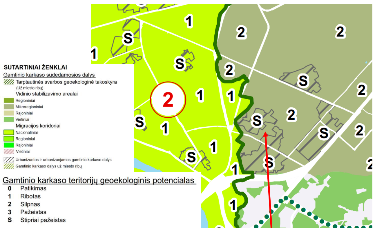
3 pav. Ištrauka iš Vilniaus miesto bendrojo plano. Gamtinio karkaso schema

Planuojamai teritorijai taikomi Bendrojo plano tekstiniai reglamentai: 32-Teritorijai ar jos daliai (pagal BP Gamtinio karkaso schemą) taikyti Gamtinio karkaso nuostatų reikalavimus;