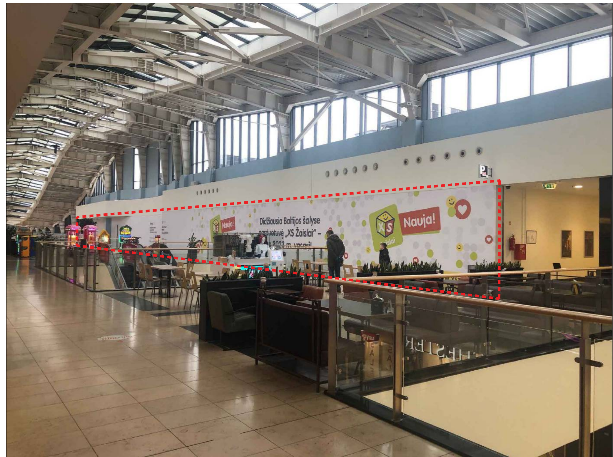
Esamo pastato vidaus nuotrauka su pažymėtomis projektuojamomis patalpomis (vaizdas D)