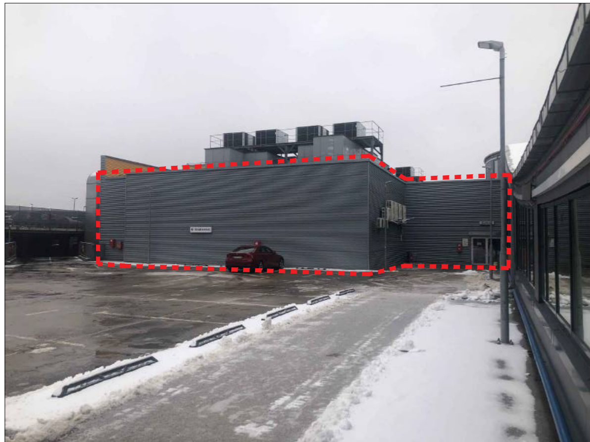
Esamo pastato išorės nuotrauka su pažymėtomis projektuojamomis patalpomis (vaizdas A)