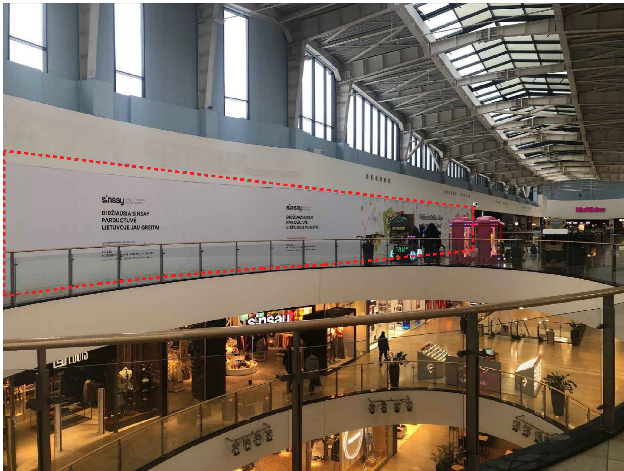
Esamo pastato vidaus nuotrauka su pažymėtomis projektuojamomis patalpomis (vaizdas C)