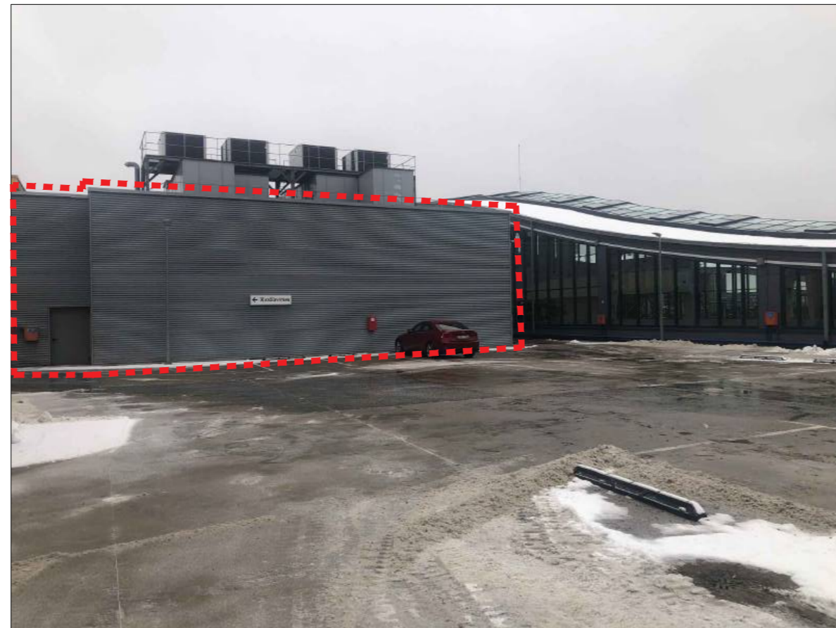
Esamo pastato išorės nuotrauka su pažymėtomis projektuojamomis patalpomis (vaizdas B)