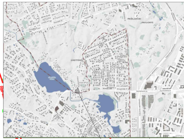
Planuojamos teritorijos vieta