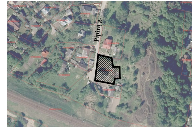
Planuojamos teritorijos vieta

Markučių rajono detaliojo plano (registro Nr. T00057292) Rasų seniūnijoje sprendinių koregavimas sklype Pipirų g. 6 (kadastro Nr. 0101/0060:60).