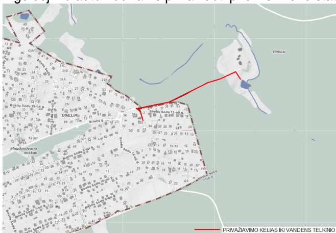
Vandens paėmimo gaisro gesinimui schema

Planiniai detaliojo plano koregavimo sprendiniai sudaro galimybę rengiant statinių techninius projektus įgyvendinti Gaisrinės saugos pagrindiniuose reikalavimuose numatytas sąlygas gaisrų gesinimo ir gelbėjimo automobiliams privažiuoti prie kiekvieno statinio ir gaisro gesinimo vandens šaltinio.